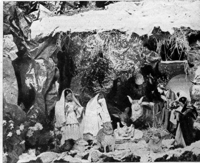
Links: Freskogemälde in der Kirche bei Greccio, das den ersten von Franziskus Anno 1223 an dieser Stelle hergerichteten Presepio darstellt • Rechts: Weihnachtskrippe (Presepio) in einer umbrischen Kirche. Das Vorbild dazu schuf Franz von Assisi