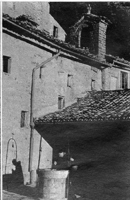
Aussen links: Plauderei auf der Piazza am Sonntagmorgen