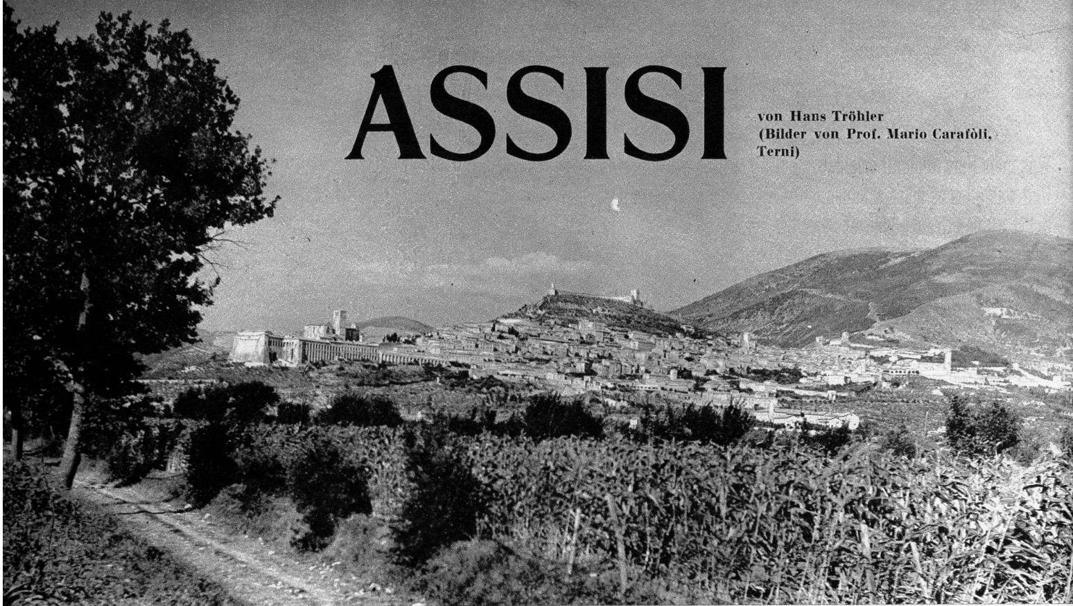
Gesamtansicht von Assisi in der Nachmittagssonne