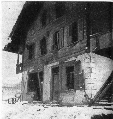
Wie im Kriege... das Haus mit dem Konsumladen, dessen sämtliche Fenster eingedrückt wurden, mit demolierten Rahmen und voller Geschosstreffer (Photo Trachsel)