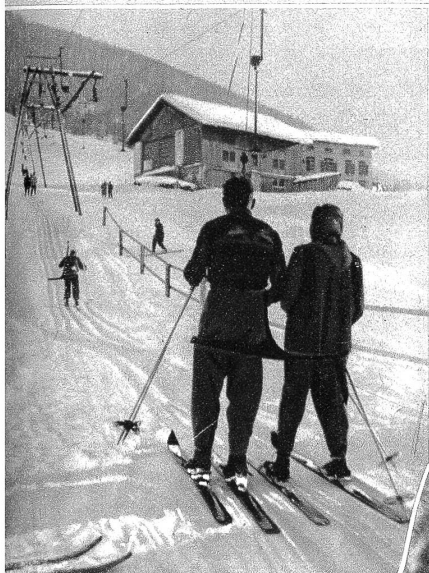
Die Anfänger-Klassen der Schweizer Ski-Schule Davos-Parsonn üben am Bolgen, wo der Skilift den zeitraubenden und beschwerlichen Aufstieg abnimmt und rasche Fortschritte ermöglicht