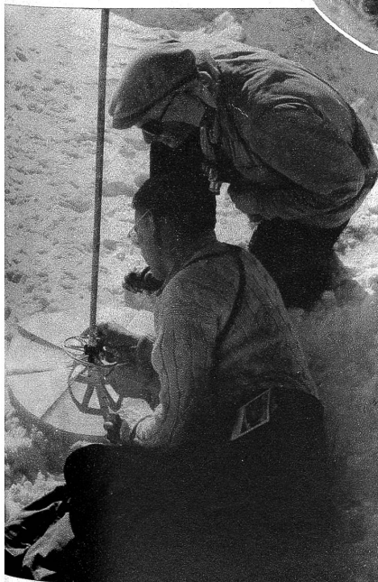
Zwei junge Engländer beim Studieren des Panoramas auf der Weissfluh, mit 2848 m der höchste Berg des Parsonngebietes. Sie geniessen das Glück eines wunderbar klaren Wintertages und können sämtliche auf dem Panorama eingezeichneten Gipfel vom Ortler im Osten bis zur Jungfrau im Westen gut erkennen