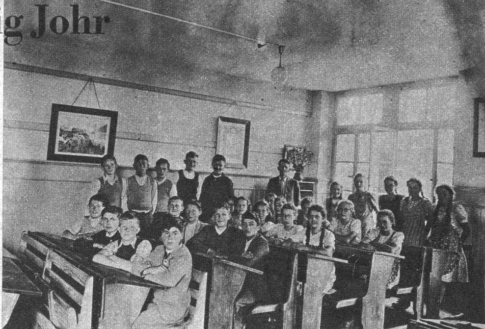
Helle und freundliche Schulzimmer erleichtern der Inser Jugend das Lernen

Am 13. Aberelle 1896 häi mier 81er vo Eiss üses letschte Schueljohr agfange. Feuf Mäitli un sächs Buebe vom Lehrer Kurth hätti ohni wyters i die oberschi Klass vo dr neu gründete Sekundarschuel chönnen yträtte. Do si aber zest nid all Eltere yverstange gsi, un es het a verschiedenen Orte Flüech u Treene gee. Bi üs han is dr Mueter u dr Grossmueter gha z'verdanke, dass i ha dörfen i die Schuel go. Dr Vatter het d'Chöschte gschücht, un dr Unggle isch o schwer drgege gsi. Wo-n-ihm aber versproche ha, i well de glych all Morge go dr Stahl mischte, d'Chalbli dränke, mit dr Milch i d'Cheeserei, d'Chüe butze un i de grosse Weerche am Vierer go chöle (grase), do het'r dene Froue müesse nohgee, bsungers wil du no grad dr neu Lehrer z'üs isch z'Hus cho un o für mi gredt het. I ha nid e wyte Schuelweg gha, aber das weerde die jetzige Schuelching scho glaupe, dass i nit