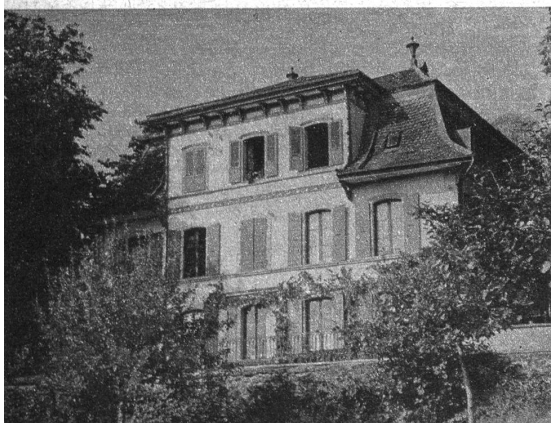
Oben: Die ehemalige Villa de Pury ist das heutige Spital Unten: Die obere Schmitte

Wie vorher die hohen und niederen Adligen und die Klöster der nähern und weitem Umgebung, so sicherte sich seit