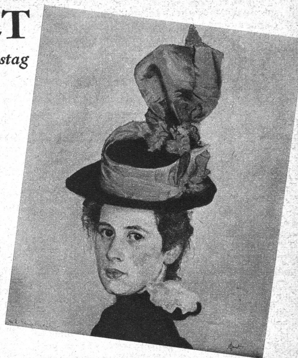
Oben: Die Gattin des Künstlers im Jahre 1898