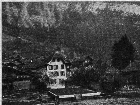
Die unterste Mühle in Merlingen

Am 11. April sind 50 Jahre verflossen, seitdem das so sonnig und heimelig am blauen Thunersee gelegene Dorf Merlingen, das sich von der Ueberschwemmungskatastrophe vom 16. Juni 1856 ordentlich erholt hatte, aufs Neue eine schwere Heimsuchung durchleben musste. Da hatte am Ostermontag oben im Dorf ein Mann mit brennender Tabakspfeife die Heubühne betreten und wahrscheinlich, ohne es zu achten, ein glimmendes Stücklein Kraut auf den Boden fallen lassen. Um halb sieben Uhr abends schlugen Flammen zum Dach hinaus, mächtig angefacht von dem aus dem Justistal niederpfeifenden «Heiterluft». Im nächsten Augenblick ergriff das wildlodernde Feuer die benachbarten Gebäude am Grünbach und jagte die Funken mit teuflischer Gewalt gegen das Dorf hinab. Ich sehe noch heute, als ob es letzte Nacht gewesen wäre, wie das glühende Flammenmeer von einem Dach auf das andere sprang und Haus um Haus vernichtete. Wohl