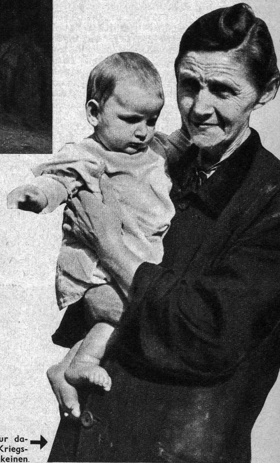
Die Grossmutter leidet Hunger, nur damit ihr Grosskind, das durch das Kriegsgeschehen elternlos geworden ist, keinen Hunger erleide. Ein Beispiel für stummes Heldentum in den Ruinen

Wir staunen über diese Tatsachen, sie sind aber wahr! Hier gilt es zu helfen, denn Niedersachsen ist nicht einzig, überall wo Krieg geherrscht hat, zeigen sich ähnliche Zustände. Helfen wir diesem Elend steuern. Geben wir für die notleidenden Kinder Europas! Sie verdienen unsere Hilfe!