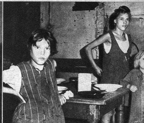
Der Gesundheitszustand ist überall bedenklich. Solche untersetzte Kinder sind daher allzu häufig anzutreffen