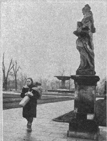
Eine Bäuerin bringt Ziegenmilch in die Stadt.