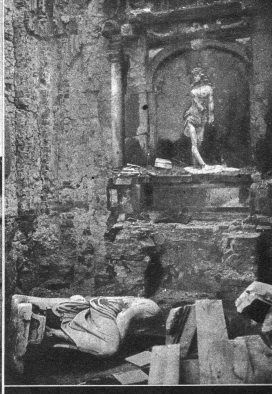
2000 Personen hatten sich während des Aufstandes im Jahr 1944 in der Kathedrale der Altstadt zu einem Gottesdienst versammelt, als ein ferngesteuerter, mit Dynamit geladener deutscher Goliath-Tank durch das Portal in die Kirche hineinfuhr und inmitten der Gläubigen explodierte. Die Kathedrale wurde 2000 Menschen zum Grab. Hier der Altar, an welchem der Priester die Messe las, als sich die Schuesslichkeit ereignete.