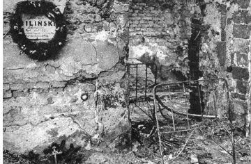
Überall erinnern in der Altstadt mit Tannengrün umkränzte Tafeln an die Opfer des Aufstandes 1944. Noch immer lebt der Warschauer Seite an Seite mit seinen Töttern, die unter den Trümmern liegen und noch nicht geborgen werden konnten. Rechts: Wo dieser kleine Warschauer wohnt? Irgendwo in den Ruinen, unter der Erde, wie mit ihm 100.000 andere auch.