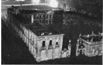
Ein gespensthafter Anblick: eine Ruinenstadt nachts. Das ausgebrannte Schloss, ehemaliger Sitz des Staatspräsidenten.