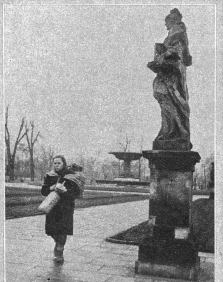
Eine Bäuerin bringt Ziegenmilch in die Stadt.

leidiger nur durch tagelanges Artilleriefeuer aus allen Rohren zu brechen vermochten. Der zweiten Vernichtungsgestappe fielen das Judenviertel, das Ghetto, und deren 400.000 Insassen, die sich nicht einfach wie Vieh in die Schlachthöfe von Auschwitz hatten transportieren lassen, im Jahr 1943 zum Opfer. Die Rache der Machtmenschen kannte keine Grenzen. Eine Wüstenei von drei Quadratkilometern Ausdehnung zeugt von ihrem barbarischen Wüten, das seinesgleichen seit der Zerstörung von Jerusalem durch Titus nie mehr gekannt hat. Doch damit noch nicht genug: im Sommer 1944, als die in Auflösung begriffenen deutschen Armeen geschlagen aus Russland nach Westen zurückfluteten und die Truppen der Roten Armee vor Warschau standen, erhob sich die Bevölkerung, um das verhasste Joch der Fremdherrschaft aus eigener Kraft abzuwerfen. Der heroische Aufstand unter General Bor brach jedoch zusammen — zum letztenmal begann die deutsche Soldatensache ein grauenvolles Vernichtungs-Wüten. Hieweil die Russen dem blutigen Aufstand Warschaus, Gewehr bei Fuss, aus der Vorstadt Praga zusehen. Die neue Geschichte Warschaus wird als Symbol der Kampfes um die Freiheit leuchten in alle Ewigkeit. WARSAU hat sich selber nie aufgegeben. Die Stadt, welche heute bereits wieder eine halbe Million Einwohner zählt, wobei fast die Hälfte freilich in Ruinenwohnungen ein armseliges Leben fristet, soll strahlender denn je wieder-erstehen. Grosszügige Pläne, an denen auch ein prominenter Schweizer Archi-