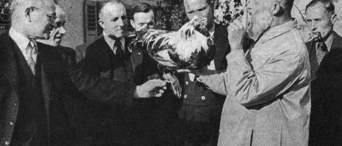
Als langjähriger Praktiker orientierte der Referent die Teilnehmer über die im Verein vertretenen Rassen

heit, dass Lehner errettet werde. Der Alte hatte die Waffen der Wissenschaft, das Fühler der Ingenieur. Der war einmal Arzt gewesen, war es jetzt noch. Welches Schicksal, welches Leid hatte ihn in die Einsamkeit getrieben? Oder auch - welche Schuld? Lange grübelte Launer dem nach, bis ihm der Schlaf sauchte die Gedanken löste. In Dorf Alpmatten begann die Besie-