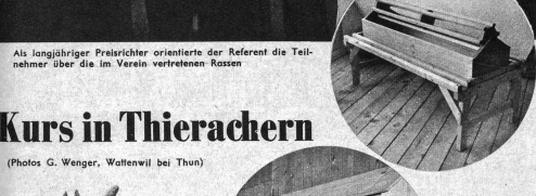
Oben: Ein praktischer Eiertrog, der von der Geflügelschule Zollikofen empfohlen wird