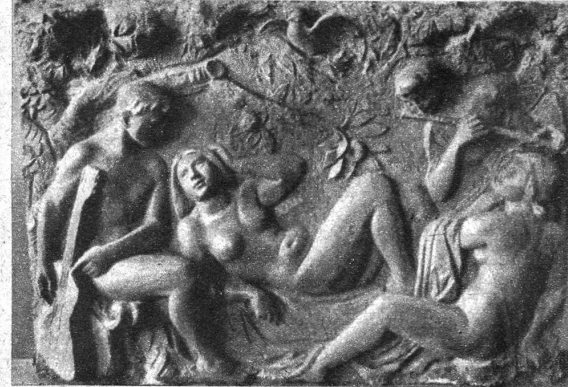
EDOUARD SPÖRRI: Konzert im Freien

Am vergangenen Samstag fand im Kunstmuseum Bern die Eröffnung der 21. Ausstellung der Gesellschaft schweizerischer Maler, Bildhauer und Architekten statt, die wie keine andere Veranstaltung Gelegenheit bietet, über das Kunstschaffen in der Schweiz Vergleiche anzustellen. Die Kunstwerke sind diesmal nach örtlichen Sektionen zusammengestellt und erlauben deshalb, sich ein gutes Bild von den künstlerischen Richtungen in den verschiedenen Gebieten der Schweiz zu machen. Mit Stolz empfindet der Beschauer das ernste Streben unserer Schweizer Künstler, die sich mit ihren Leistungen auch in internationalen Kunstkreisen