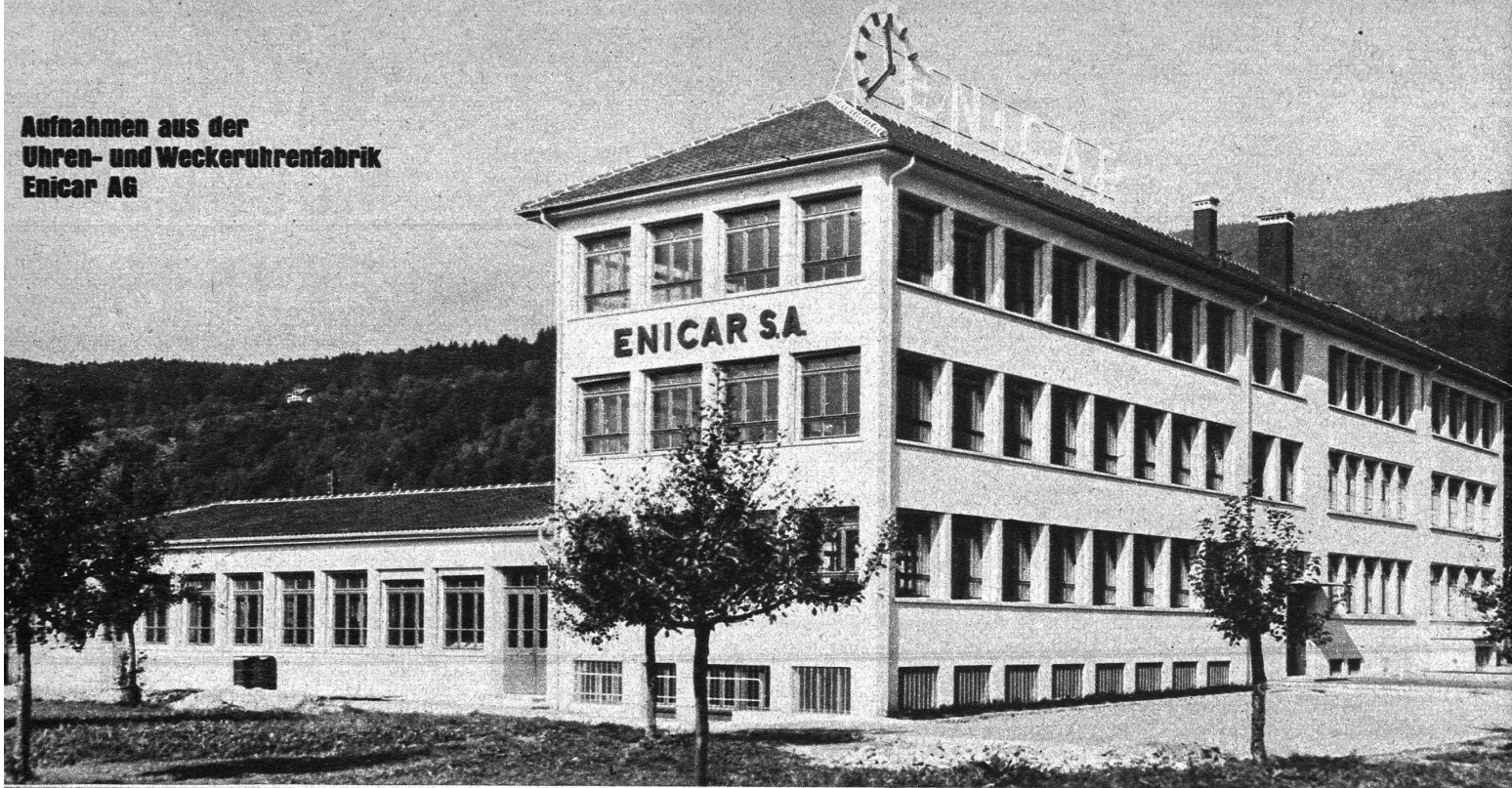
Die Fabrik der Enicar AG in Lengnau

Aufnahmen aus der Uhren- und Weckeruhrenfabrik Enicar AG