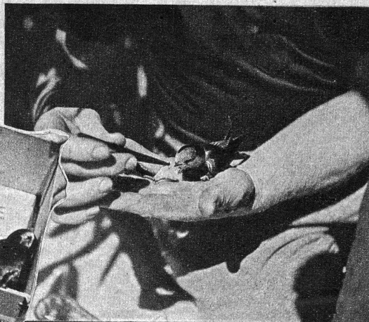
Links: Etliche Jungvögel nehmen das Futter bald aus des Pflegers Hand, während andere mit der Pinzette gefüttert werden wollen, weil diese dem mütterlichen Schnabel gleicht. Rechts: Hier werden Verletzte und Verunfallte behandelt

Leider ist der Mitgliederbestand der Vogelvolièrengesellschaft klein, die Aufwendungen dagegen sehr gross. Braucht es doch allein ca. Fr. 500.— nur für Vogelfutter (Ameiseneier), um all die Findlinge, Verirrten, die kranken und verletzten Alt- und Jungvögel aufzufüttern.