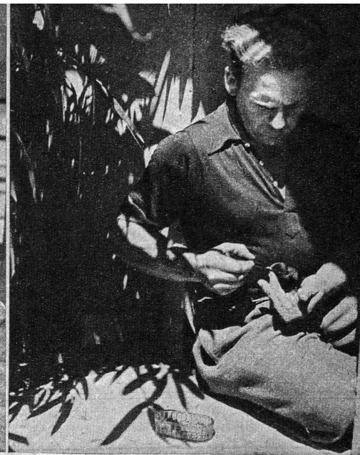
Der Wärter hat oft den ganzen Tag alle Hände voll zu tun, um die vielen Verlaufenen, Verfliegenen, Verirrten mit Weichfressnahrung zu füttern