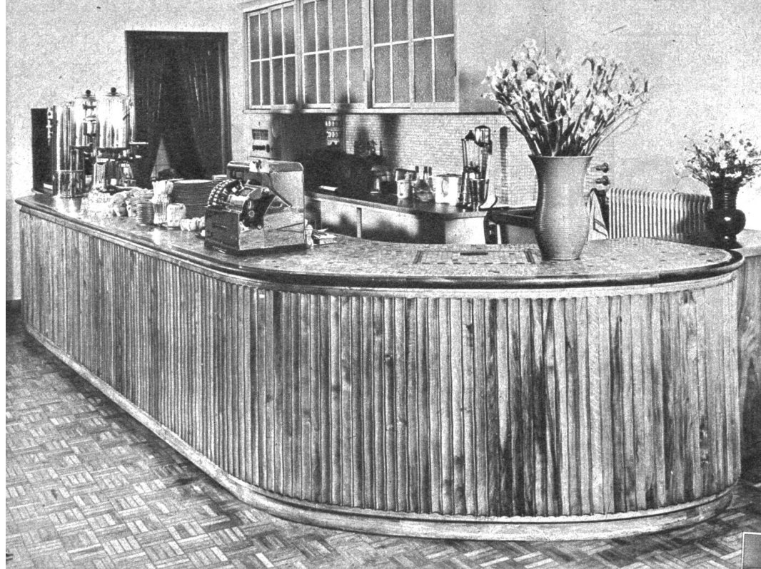
Das formschöne Buffet in Nussbaum im Tea-Room Rio, ausgeführt von der Firma Künzi

trolle der fertigen Arbeiten noch mehr verschärft.