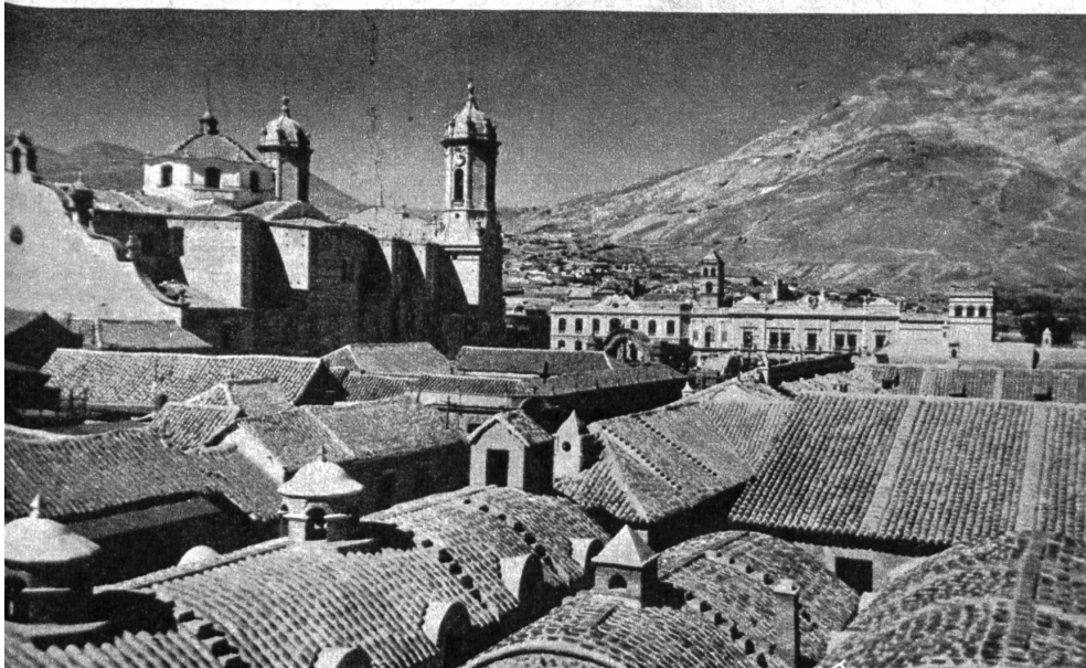
Blick auf die alten Dächer und die Kathedrale von Potosí. Im Hintergrund der «Cerro»