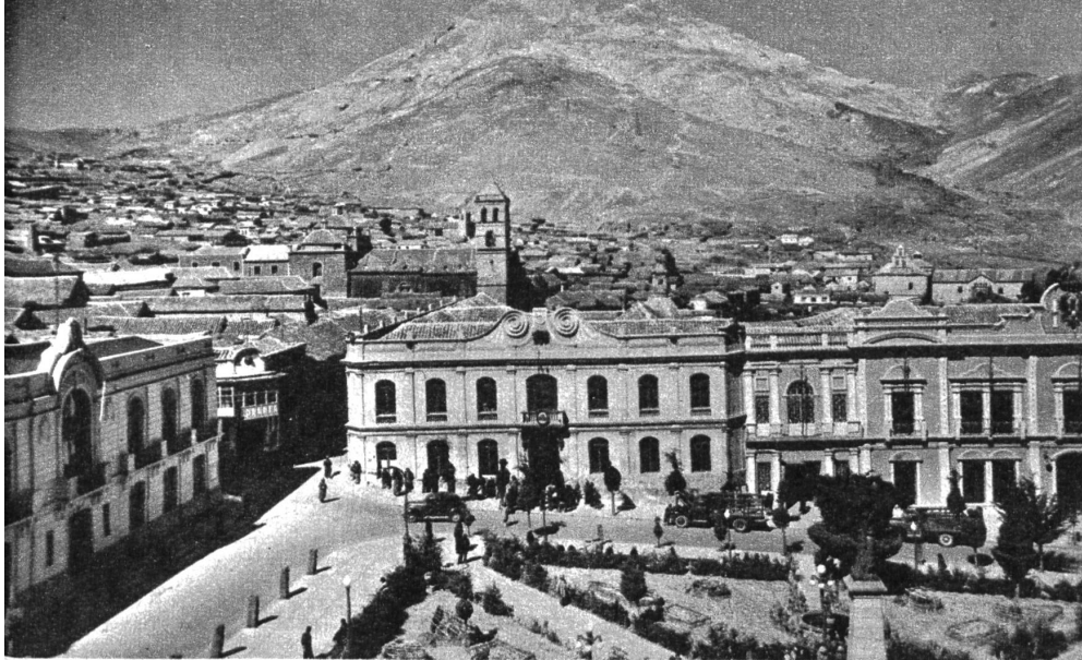
Blick auf die Stadt Potosí, im Hintergrund der berühmte «Cerro rico»