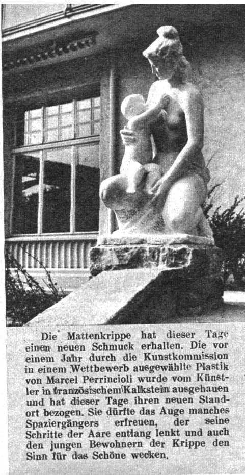
Die Mattenkrippe hat dieser Tage einen neuen Schmuck erhalten. Die vor einem Jahr durch die Kunstkommission in einem Wettbewerb ausgewählte Plastik von Marcel Perrincioli wurde vom Künstler in französischem Kalkstein ausgehauen und hat dieser Tage ihren neuen Standort bezogen. Sie dürfte das Auge manches Spaziergängers erfreuen, der seine Schritte der Aare entlang lenkt und auch den jungen Bewohnern der Krippe den Sinn für das Schöne wecken.

herbe Schneewinkelhorn gleich weichen, lindern Frauenarmen, die sich um einen eingepanzerten Krieger schlingen. Sie drangen aus der Tiefe der Staffalp in die weltferne Höhe und klangen so feierlich, weil sie heute zum ersten Male sargen und jubelten. Dem gestern abend war in die Hütte der Alp neues Leben eingezogen; mit etwa zwanzig Stück Vieh, mit seinem Sohn, dessen Weib und Kind, war der strubmähmige, alte Senn, den im vergangenen Jahr Lauener in der oberen Hütte getroffen hatte, auf die Staffalp gekommen.