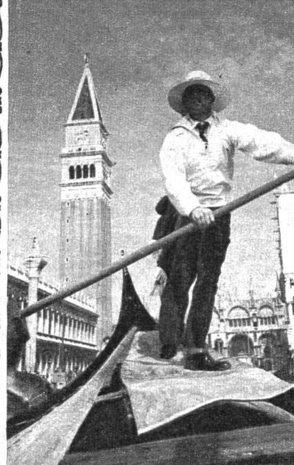
Das ist der echte «Gondoliere veneziano»: mit einem Ruder steuert er kunstvoll seine Gondel durch die Wasserstrassen Venedigs

Der Leitner war einverstanden — und nach wenigen Monaten zogen Resi und Martin als Brautpaar im neuen Leitnerhof ein. E. Held