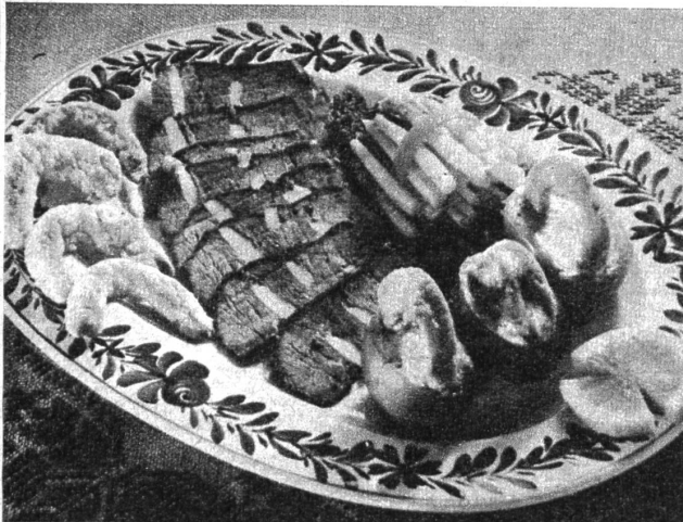
Gespickter Braten, garniert nach Tiroler Art

Sie kennen Tante Hanna? Nicht? — nun Tante Hanna kommt zum erstenmal in den jungen Haushalt, und da möchten Sie doch ein Essen aufstellen, das auf gar keinen Fall irgendwie nicht gelingen kann. Doch — es sollte was Besonderes sein. Hier ein Vorschlag: