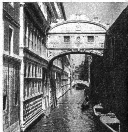
Die Seufzerbrücke, die den Dogenpalast mit dem alten Gefängnis verbindet. Von hier habe man die Seufzer der Gefangenen vernommen, die vor den Richter geladen oder verurteilt ins Gefängnis zurückgeführt wurden

Der grossartige Markusplatz, einem riesigen Marmorsalon ähnlich, die byzantinische, an orientalische Verträumtheit erinnernde Basilika San