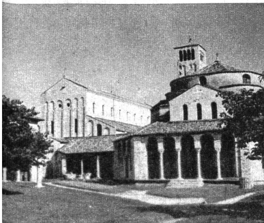
Die Insel Torcello, einst der Mittelpunkt des aufsteigenden Venedigs. Heute verträumt und einsam, die Piazza vom Grase überwuchert...