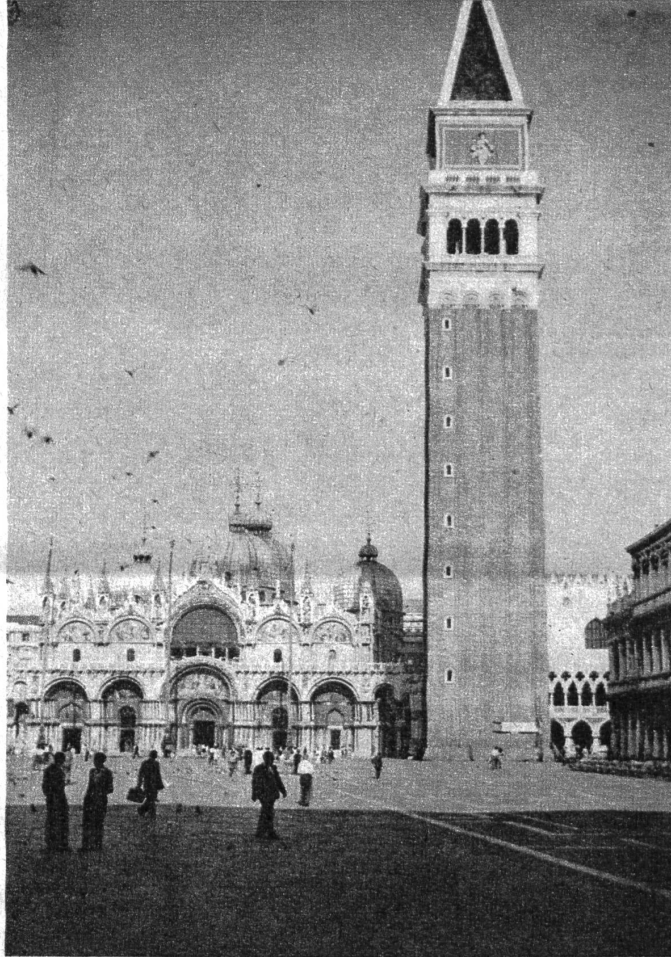
Der Markusplatz ist zweifellos der schönste Platz der Welt

blieben. Die Lagunenstadt wird nie das Opfer der modernen Grossstadt-herze sein und die Venezianer werden nie durch die herzlose Maschine verklärt werden. Wenn sie morgens auf dem „Vaporetto“ zur Arbeit fahren oder abends heimkehren, immer entdecken sie etwas Neues an den prunkvollen Palästen, die die grossartige Wasserstrasse säumen, stärken sie sich innerlich am Ruhme vergangener Zeiten: die Fahrt durch den Canal Grande ist für sie jedesmal ein neues, erbauendes Erlebnis, das eben trotz Gewohnheit nicht mit einer Traumfahrt verglichen werden kann. Welch ein Unterschied zwischen einem lachenden, sonnigen Morgen in Venedig und der muffigen Luft einer Pariser Metrostation mit blitzartig herangeleitenden Zügen, automatisch sich öffnenden und zuklappenden Türen und den unzufriedenen Gesichtern gehetzter Grossstadtmenschen!