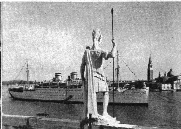
Ein Ueberseedampfer liegt im Bacino von San Marco vor Anker