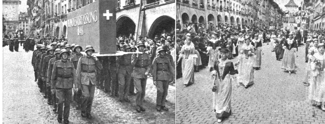
Links: Ausschnitt aus dem grossen Festzug: Ein Detachement Soldaten trägt ein Symbol der eidgenössischen Bundesverfassung von 1848. — Rechts: Im zweiten Teil des grossen Jubiläumsfestzuges zur 100jährigen Bundesverfassungsfeier kam die unzer trennbare Bindung zwischen Volk und Staat sinnig zum Ausdruck. 2000 Trachtenleute aus allen Gegenden der Schweiz begleiteten 3000 Gemeindefahnen als Symbol freier Gemeinden auf ihrem Ehrenmarsch durch die Bundesstadt

Der Wettergott hatte am Sonntag die Veranstalter der grossen Verfassungsfeier gezwungen, den Gedenkakt in der neuerichteten grössten Festhalle der Schweiz auf der Berner Allmend durchzuführen. - Unsere Aufnahme zeigt die vereinigten bernischen Chöre und die Berner Stadtmusik bei einem Vortrag auf der immensen Bühne. Musikalische Leitung W. Aeschbacher