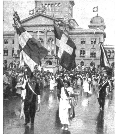
Die eidgenössische Sängertfahne im Festzug. Im Hintergrund das Wahrzeichen der Bundeshauptstadt, das Parlamentsgebäude (Photopress)

Der farbenprächtige und reichhaltige Umzug lockte am Nachmittag gross und klein, alt und jung in die Stadt und wurde