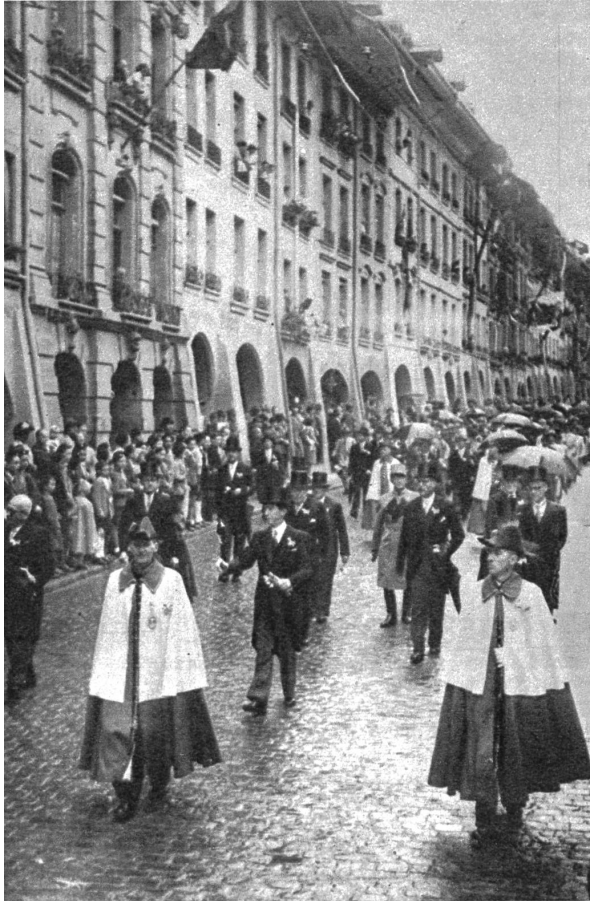
Die Bundesväter auf dem Gang ins Berner Münster zur offiziellen Verfassungsfeier. — Am Morgen begaben sich die Bundesräte, Delegationen aller Kantone und der Eidgenössischen Räte sowie die geladenen, um das Ansehen der Eidgenossenschaft verdienten Ehrengäste zur erhabenen Verfassungsfeier ins historische Berner Münster