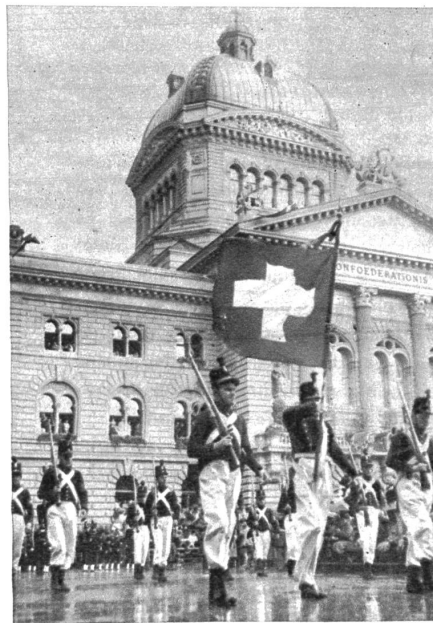
Den Jubiläumstestzug eröffneten Soldaten aller Waffen aus dem Jahre 1848 in historischen Uniformen. Scharfschützen begleiteten als Fahnenwache das neue Schweizerbanner über den Bundesplatz

Am Sonntag begannen die Feierlichkeiten: 100 Jahre Bundesverfassung mit einem Gottesdienst in verschiedenen Kirchen der Stadt. Die offiziellen Teilnehmer, voran der gesamte Bundesrat und die Vertretungen unserer Eidg. Räte, sowie zahlreiche Gäste, versammelten sich im