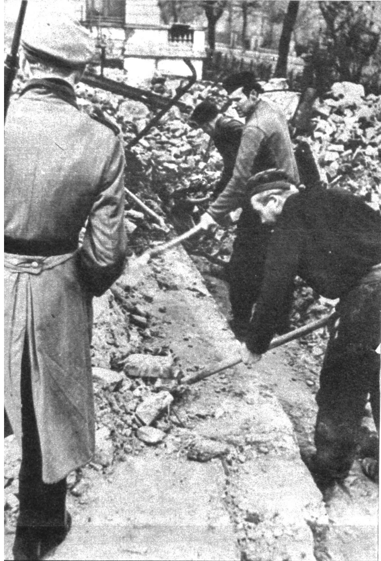
Auch eine Methode zur Kurierung von Schwarzhändlern; In Hamburg (britische Zone) werden Schwarzhändler für Aufräumarbeiten herangezogen. Diese «Kur» hat den Vorteil, dass sie dem Anschein nach noch viele Jahre angewendet werden kann: solange es in Deutschland noch Ruinen gibt! Unser Bild zeigt drei Schwarzhändler, die unter Bewachung eines Polizisten Schutt wegräumen.

Jagdfrevel im Nationalpark? Aus dem italienischen Livigniotal treffen im Engadin immer wieder prachtvolle Steinbockgeweihe ein, die von Tieren stammen, die die Italiener schossen. In Zernez sind erneut zwei auserlesene Geweihe angekommen, und die Vermutung liegt nahe, es handle sich um einen gemeinen Jagdfrevel im Nationalpark (ATP.)