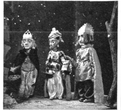
«Wir sind die heiligen drei weisen Mann, Wollen gern das Kindlein beten an.»