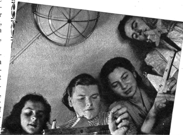
Links: Das Spielen mit den Fingern fordert gespannte Aufmerksamkeit und grosse Geschicklichkeit. Keinen Augenblick darf man seine Finger ausser Acht lassen oder den Arm sinken lassen. Der Raum auf der Bühne ist eng, und es heisst ständig aufpassen, dass sich nicht die Fäden zweier Figuren verwickeln

«Und kniee nieder und danke Gott auf den Knien, mein Schwiegersonn», fuhr der Färber fort, «dass kein Wind gegangen ist. Hundert Jahre werden wieder vergehen