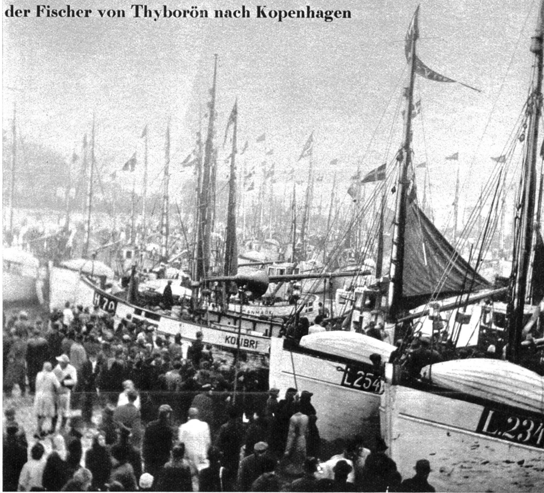
Der vielbestaute Mastenwald im Yachthafen von Langenlinie anlässlich der Demonstrationsfahrt der Fischer von Thyborön nach Kopenhagen