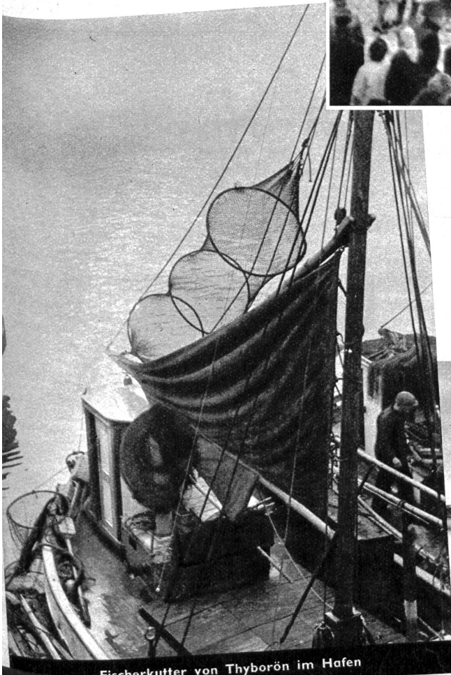
Fischerkutter von Thyborön im Hafen

Links: Bei Ebbe liegen die Fischerboote auf dem Strand. Dann fährt ein Wagen hinaus und übernimmt die Last. — Rechts: Am Thyborön-Kanal. Deutlich zeigt dieses Bild die Wirkung einer der bereits erstellten wellenbrechenden Molen. Auf der Seeseite spritzende Brandung, in Lee ruhiges Wasser