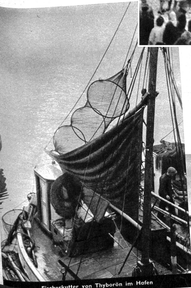
Fischerkutter von Thyborön im Hafen

Links: Bei Ebbe liegen die Fischerboote auf dem Strand. Dann fährt ein Wagen hinaus und übernimmt die Last. — Rechts: Am Thyborön-Kanal. Deutlich zeigt dieses Bild die Wirkung einer der bereits erstellten wellenbrechenden Molen. Auf der Seeseite spritzende Brandung, in Lee ruhiges Wasser