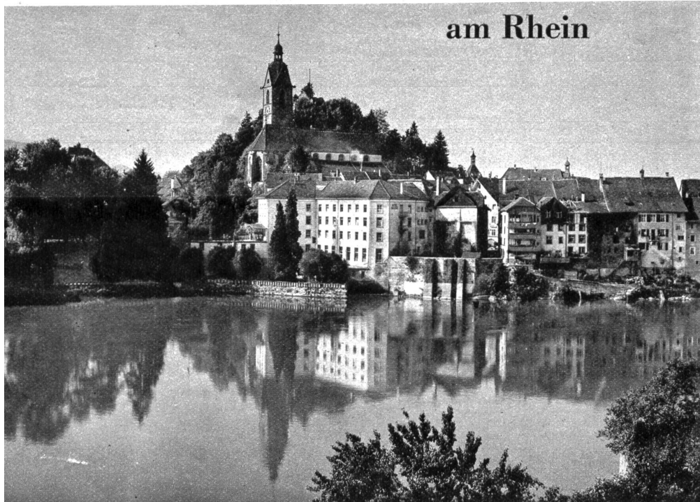
Das romantische Städtchen Laufenburg, im Hintergrund der Schlossberg mit Stadtkirche St. Johannes und Ruine Habsburg-Laufenburg

des heutigen Laufenburg Fischer, Flösser und Schiffer ihre Hütten bauten und später die römischen Soldaten, die den Rheinübergang mit zwei bewehrten Wachttürmen schützten vor den räuberischen Horden aus den finstern Wäldern des Nordens, um den trotzigen Schlossberg mit seiner heute efeumrankten Ruine Habsburg-Laufenburg ihre Militärbauten errichteten. Unter Valentinian I. (373 n. Chr.) wurde der römische Grenzwall am Rhein längs dem heutigen Aargau, bei Kaiserstuhl und Laufenburg durch je zwei starke Kastelle und bei Rheinfelden durch ein verzacktes Lager unterhalten.