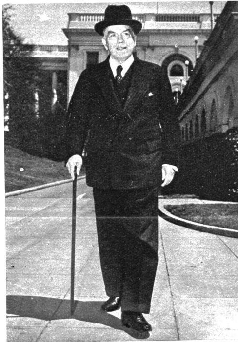
Mackenzie King will zurücktreten

Natürlich haben die drei nordischen Länder, aber auch unser Land und die übrigen, nicht direkt von den englischen Blockplänen betroffenen Länder, nichts dagegen, dass die Wirtschaft allenthalben wieder floriert, dass dadurch die sozialen Spannungen reduziert, die Bedrohung durch russische «Fünfte Kolonnen» ausgeschaltet, und dass durch eine militärische Bereitschaft der «fünf Blockländer», welchen sich Italien ganz selbstverständlich anschliessen wird, auch die Bedrohung durch die russischen Millionenheere vermindert wird. Praktisch wird darum das