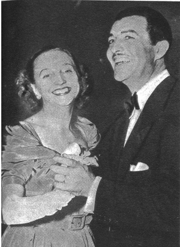
Anlässlich eines Wohltätigkeitsballes der amerikanischen Marine sah man die Tochter des Präsidenten, Fräulein Margarete Truman, mit dem bekannten Filmkünstler Robert Taylor tanzen, der bei diesem Anlass als «Maitre de Cérémonie» funktionierte

Durch die ausserordentlichen Kälte- u. Schneestürme in Amerika ist der North River bei New-York ganz mit Eisschollen bedeckt