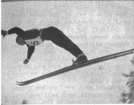
Petter Hugsted (Norwegen), prächtiger Sieger des Spezial-Sprunglaufs.

leichten «Spleen». Es ist dies ein Lieblingswintersport der Angelsachsen. «Das will aber nicht heissen, dass hier kein anderer gewinnen kann», wird wohl auch der Italiener Bibbia gedacht haben, der in der Gesamtwertung obenaus schwang und die Goldmedaille gewann.