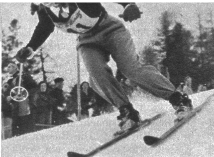
Gretchen Fraser (USA), die grosse Ueber- raschung, holte sich im Spezialschlalom die Goldmedaille.