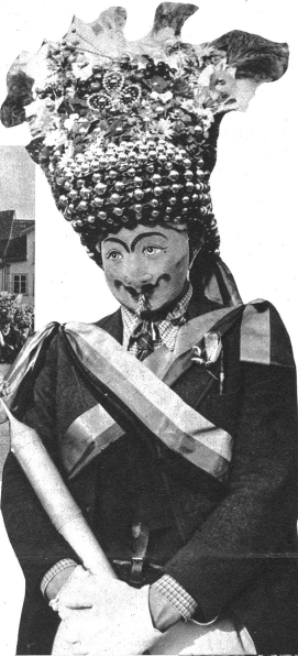
Ein „Röllelibutz“ in seinem vollen Zunftschmuck. Die „Röllelibutzen“ verkörpern das Symbol der Fruchtbarkeit. Dabin deuten auch der reiche, Früchte und Blumen darstellende Kopfschmuck, die Ähre im Mund und wohl auch die Wasserspritze.