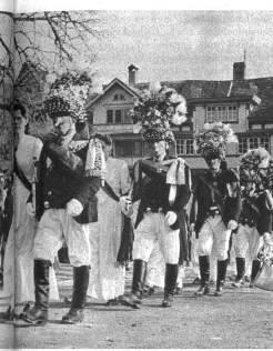
Zülig treten auch die Ehrendamen in den Reigen ein, um bunte Spiel mit weiblicher Anmut zu ergänzen.