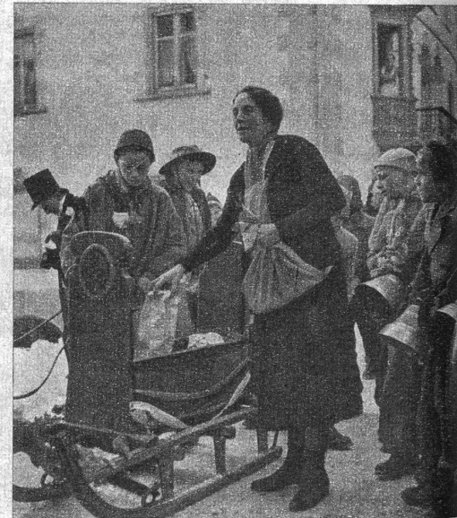
Der «Chef» sammelt die Gaben, die aus Nüssen, Äpfeln, Würsten und Leckerbissen bestehen