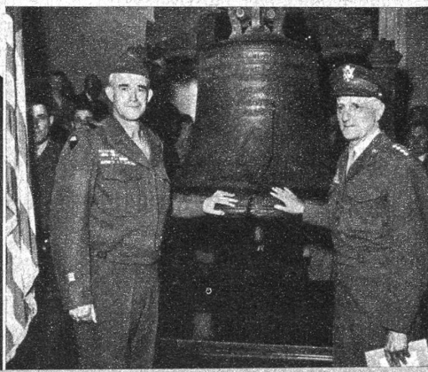
Bradley und General C. A. Spatz berühren die «Freiheitsglocke» der USA. in Philadelphia nach ihrer Rückkehr aus Europa, anlässlich welcher ihnen die Stadt einen frenetischen Empfang bereitet hatte

Als General Bradley nach seiner glänzenden Truppenführung in Nordafrika einen Orden erhielt, rühmte der Tagesbefehl seine «kühne Entschlossenheit, sein gesundes Urteil, sein überlegenes taktisches Geschick, seinen kaltblütigen Mut und den entschlossenen Willen, die persönliche Verantwortung zu übernehmen». Wer ist der Mann, der mit solchem Lob bedacht wurde und anstelle des Generals Eisenhower den höchsten Posten in der amerikanischen Armee übernommen hat?