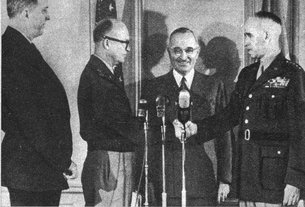
Im Weissen Haus in Washington fand die feierliche Vereidigung des neuen Generalstabschefs der amerikanischen Armee, General Omar Bradley (rechts) statt, die von seinem Vorgänger, General Dwight D. Eisenhower (zweiter von links), nunmehr Präsident der Columbia-Universität, vorgenommen wurde. Der Zeremonie wohnten Kriegsminister Kenneth C. Royal (links) und Präsident Truman bei