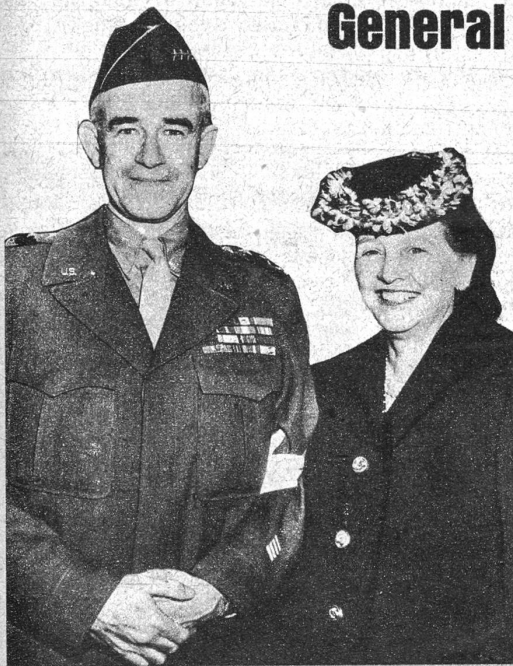
Generalmajor Omar N. Bradley, amerikanischer Infanterie- und Artillerie-Experte, als Kommandant der 1. Armee nach seiner Rückkehr aus Europa. Unser Bild zeigt ihn mit seiner Frau

Der neue Höchstkommandierende der amerikanischen Armee