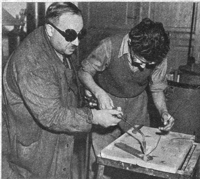
Diese Beiden haben nicht immer den LötKolben geführt, i.n. Gegenteil. Derjenige links war früher ein angesehener Chirurg. Seit er aber in Dachau seinem Berufe nachgehen musste, mag er davon nichts mehr wissen