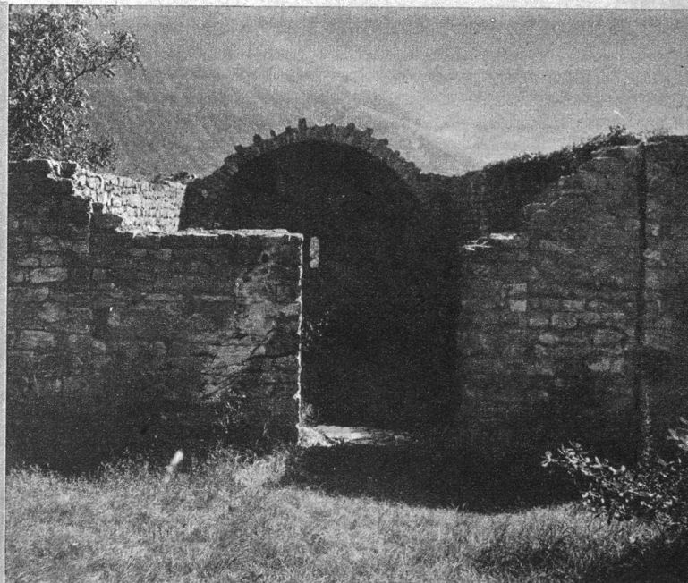
Rechts: Ruinen einer alten Schlosskapelle