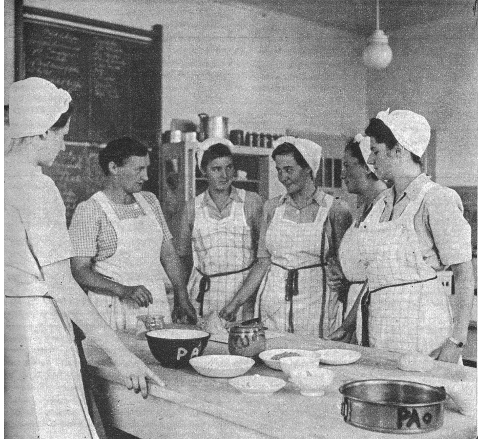
Im ersten Teil des Hausbeamtinnenkurses (Jahreskurs) werden die Schülerinnen systematisch mit der rationellen Zubereitung einfacher und zusammengesetzter Mahlzeiten vertraut gemacht