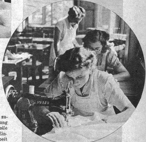
Kreis: Die Instandhaltung der teuren Wäsche ist für Privathaushaltung und Grossbetrieb gleich notwendig und bedeutungsvoll. Unten: An Hand der eingegangenen Bestellungen verteilt die angehende Hausbeamtin die Lebensmittel in die Küchen