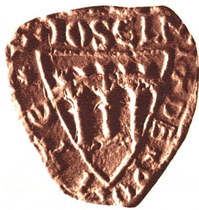
Siegel des Joselin von Pont, 1250