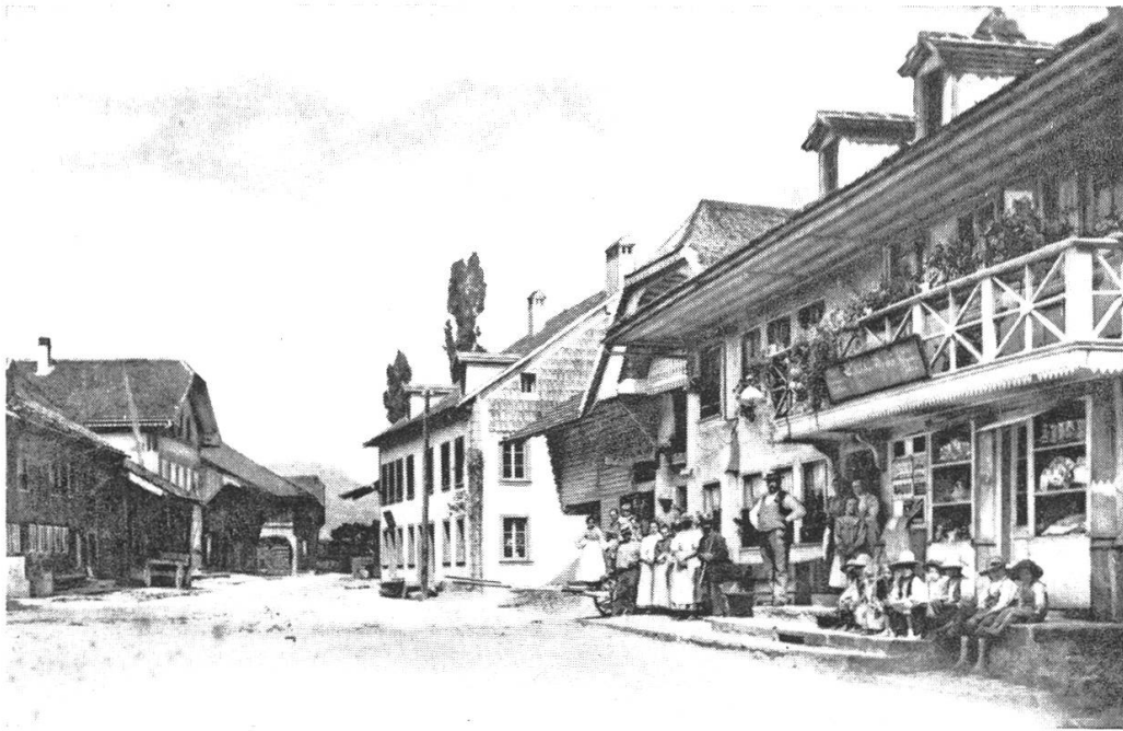
Die Dorfstrasse vor dem Brand