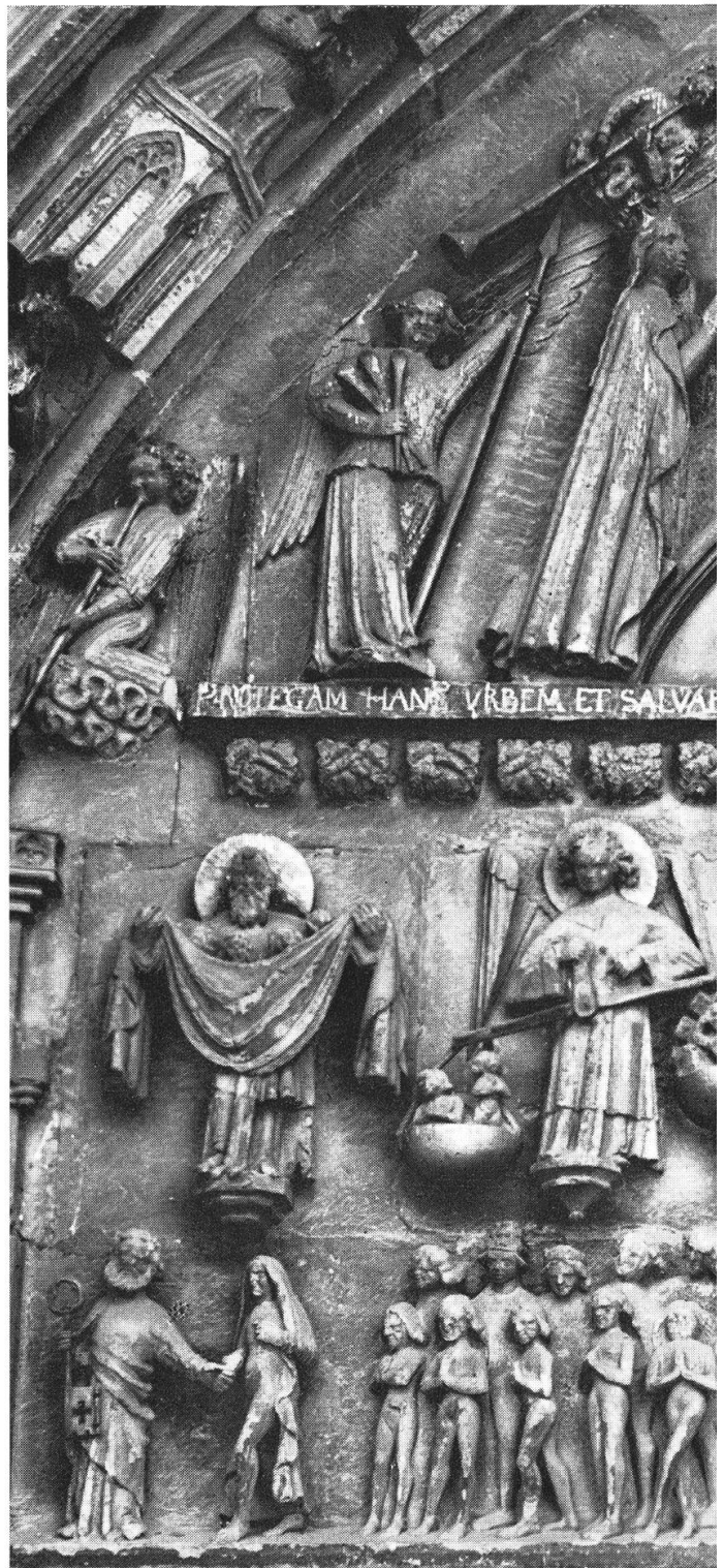
Jüngstes Gericht, Relief im Tympanon der St. Nikolauskathedrale (2. Hälfte 14. Jh.). Freiburg i. Ü.