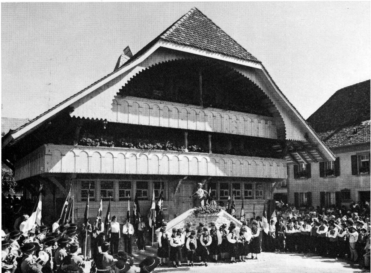
Der Festakt vor dem Heimatmuseum.