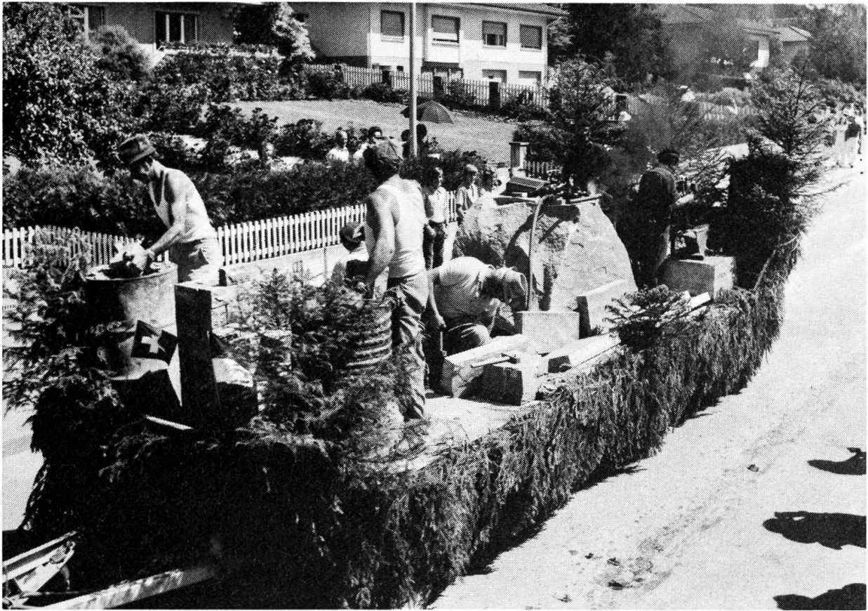
Steinindustrie, Plasselb.