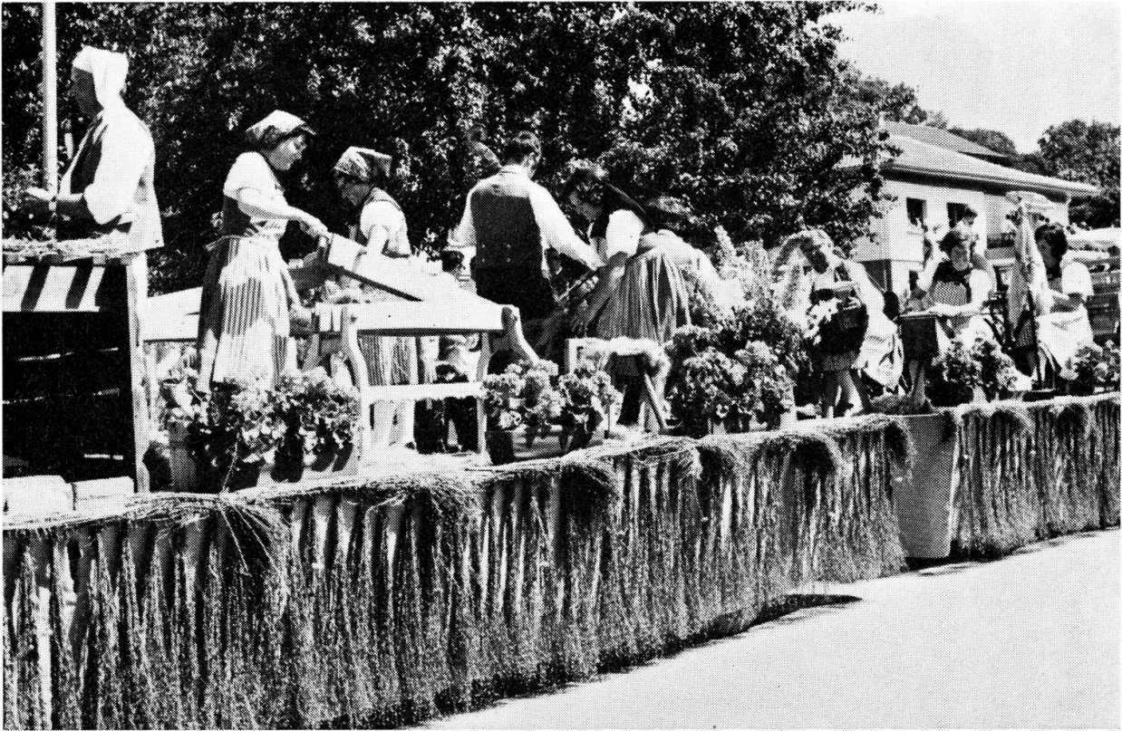
Vom Hanf zum Stoff, Bösinggen.