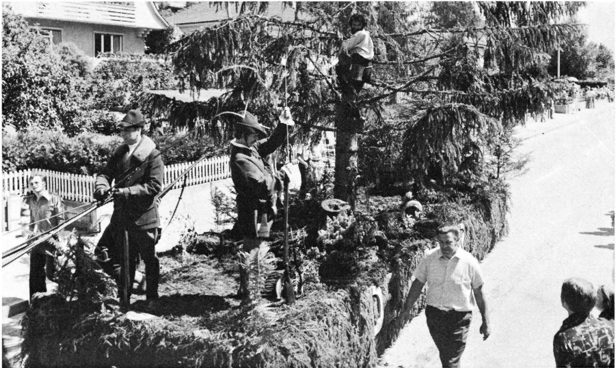
Der Harzer, Giffers.