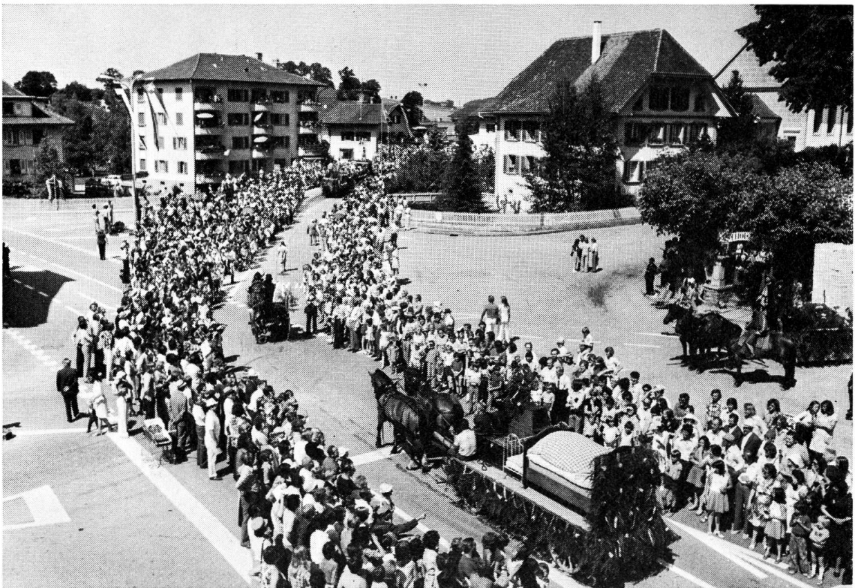
Hochzyt zu alter Zyt, Heitenried.