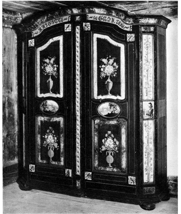
Reichbemahte Senslerschränke.