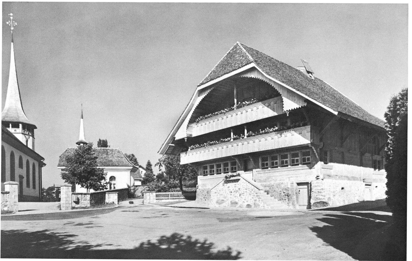
Das Heimatmuseum mit Kirche St. Martin und Friedhofkapelle.