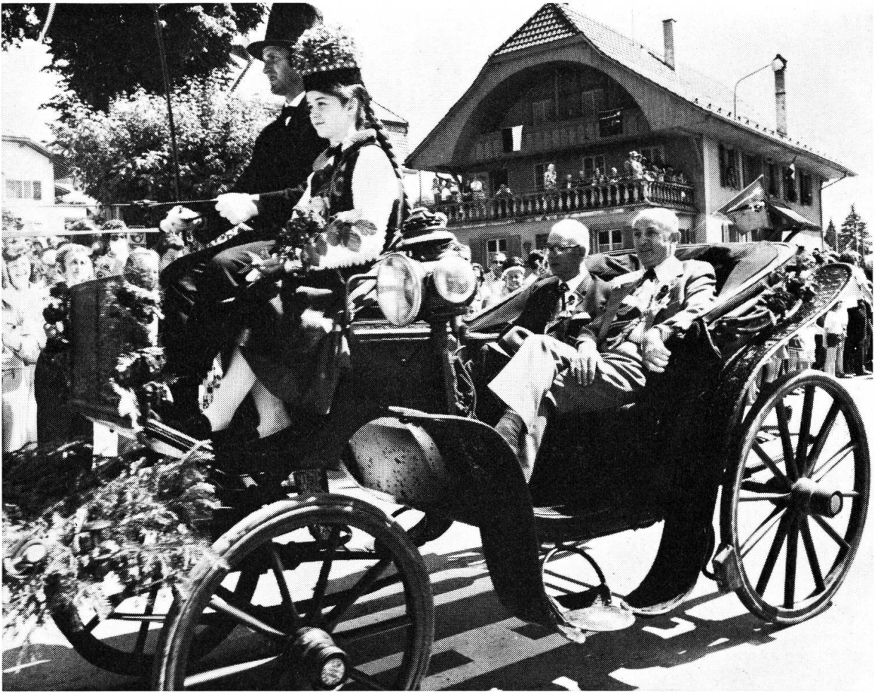
Die Ehrenkutsche.