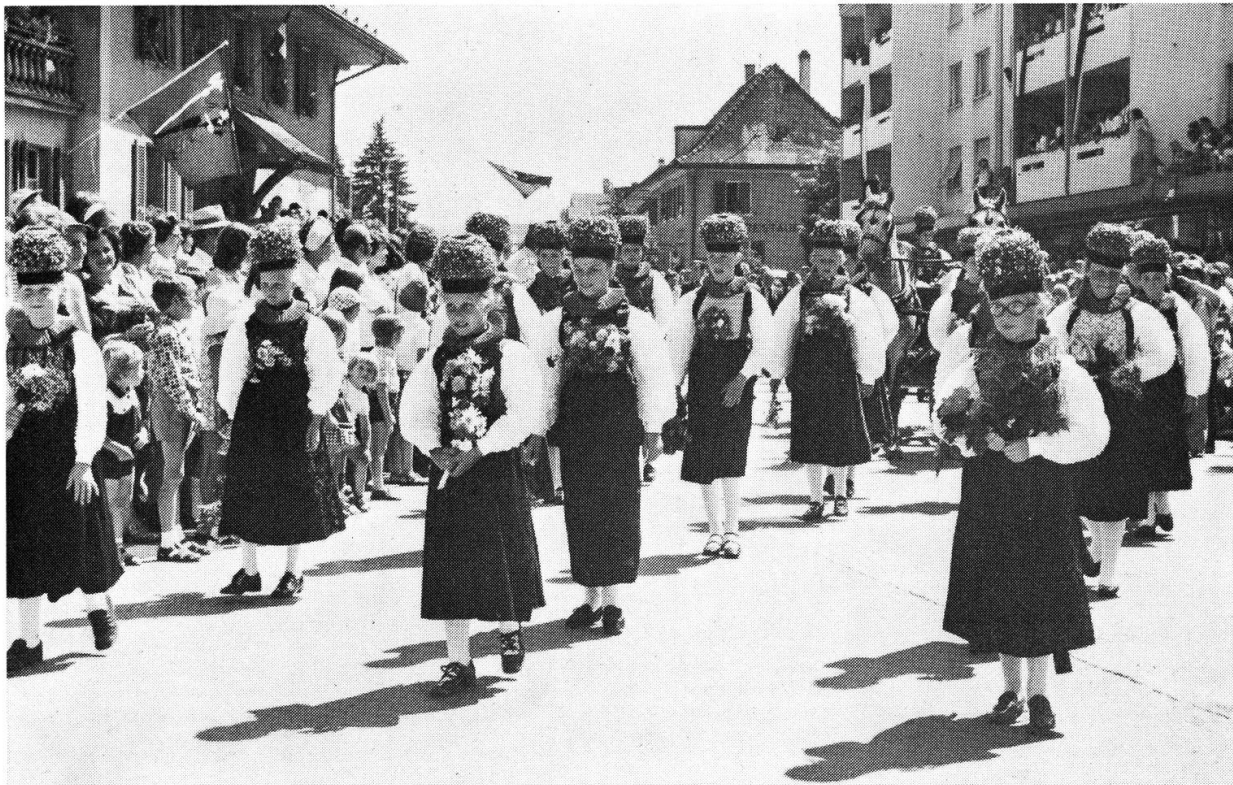
Chränzlitöchter von Tafers.