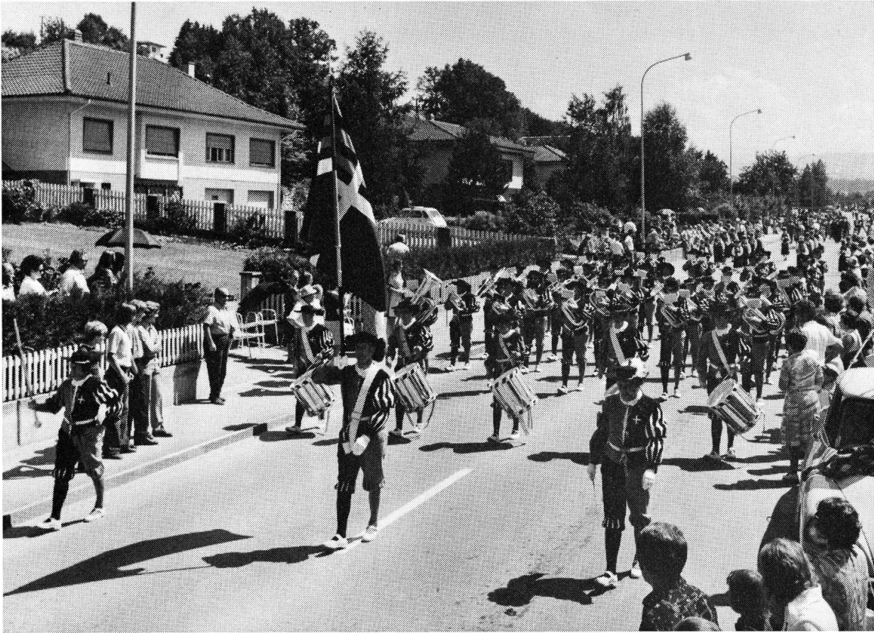
Musikgesellschaft Tafers.