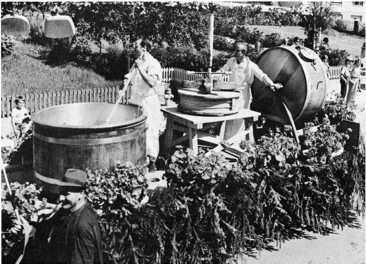
Käserei, St. Antoni.