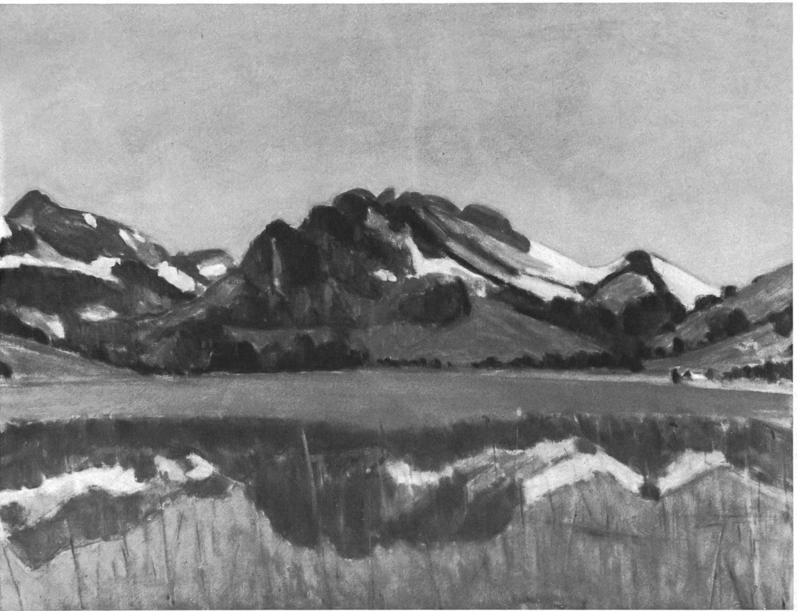
Aus der Ausstellung Nr. 4: Sensler Landschaften Hiram Brillhart, Schwarzsee, um 1935, 86 × 67 cm. Musée Gruyères, Bulle.