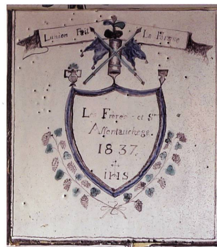
Fig. 3 La signature de l'atelier et la date de 1837

documentation du poêle (fig. 1) et d'emprunter quatorze catelles de types différents pour compléter le catalogue des productions de l'atelier. En 2015, Mme Guigoz, en accord avec le Musée gruérien, décida de léguer au Service archéologique les catelles isolées en sa possession, 53 pièces, toutes transmises par des descendants de la famille Affentauchegg, active durant trois générations à la rue de la Poterne (1792-1893).