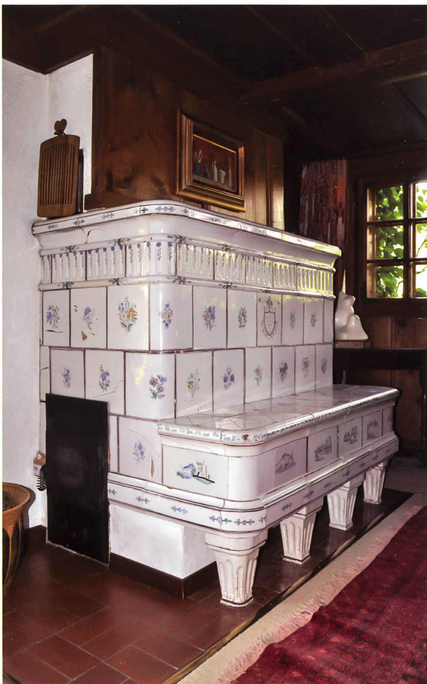
Fig. 1 Poêle produit à Bulle par la famille Affentauschegg, 1837

Les résultats des recherches effectuées sur les premières découvertes fortuites des productions de la Poterne, en 2007, avaient été présentés au public dans le cadre de l'exposition «Découvertes archéologiques en Gruyère. Quarante mille ans sous la terre» qui s'était tenue, en 2009, aux musées de Charmey et de Bulle 1 . C'est lors du vernissage au Musée gruérien de Bulle que Mme Guigoz nous avait aimablement signalé qu'elle possédait des catelles et un poêle partiellement remonté, issus de l'atelier de la Poterne. Une visite à Sommentier en 2009 a permis de réaliser une première