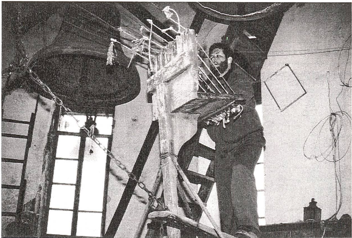
Athos: Agion Panteleimon