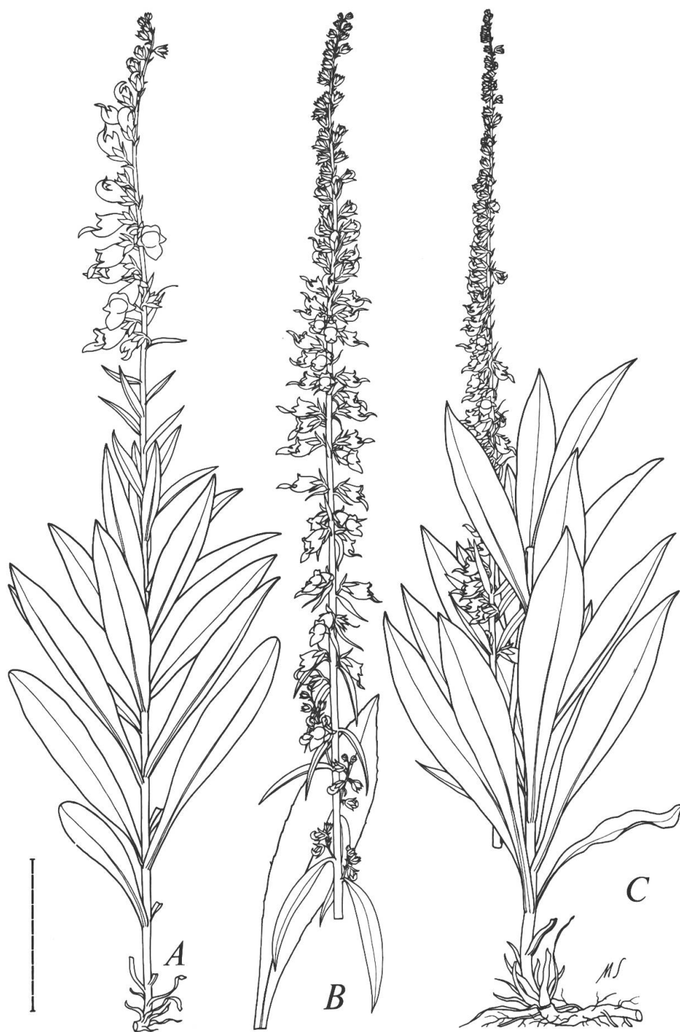
Fig. 1. — A. Digitalis laevigata Waldst. & Kit. (Braig, ZT 9630); B. D. graeca Ivanina var. megalantha Bocquet & Zerbst (Zerbst 30189); C. D. graeca Ivanina var. graeca (Zerbst 30238); (Marta Seitz turicensis del.)