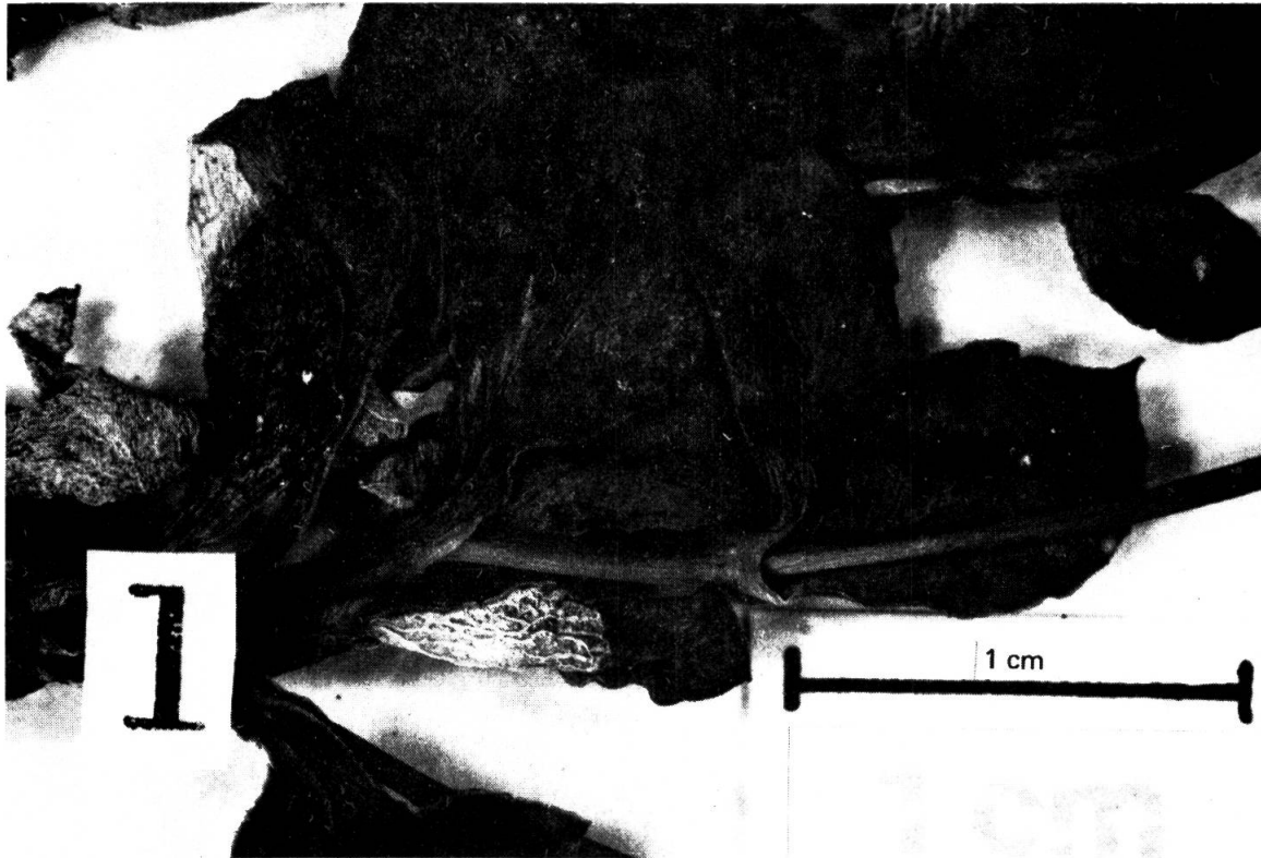
Fig. 2. — Détail du lectotype (échantillon n° 1).