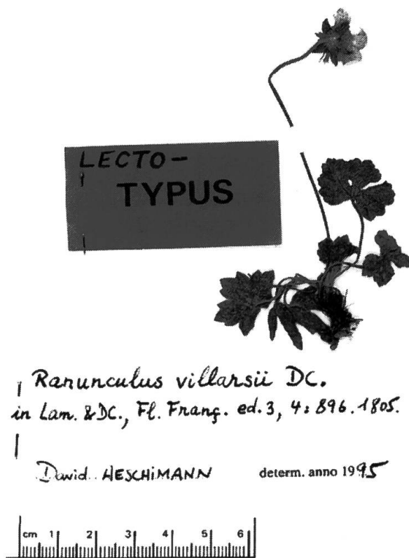
Photo 1. — Lectotype du Ranunculus villarsii DC.: échantillon en haut à gauche de la planche n° 344 de l'herbier de Villars, GRM.