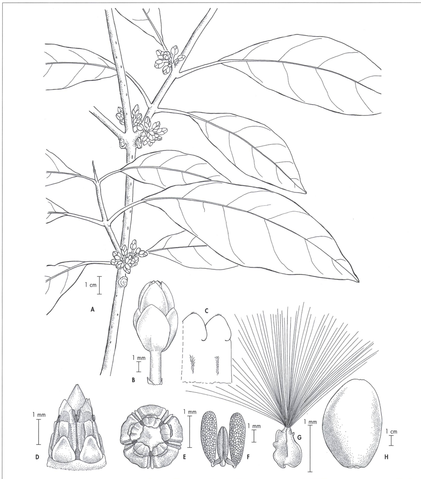
Fig. 1. – Marsdenia cuixmalensis Juárez-Jaimes & L. O. Alvarado. A. Rama con inflorescencias; B. Flor; C. Detalle del interior de la corola; D. Ginostegio; E. Vista apical del ginostegio; F. Polinario; G. Semilla; H. Fruto.

[Lot# 3651, MEXU] [Dibujo de E. Esparza]