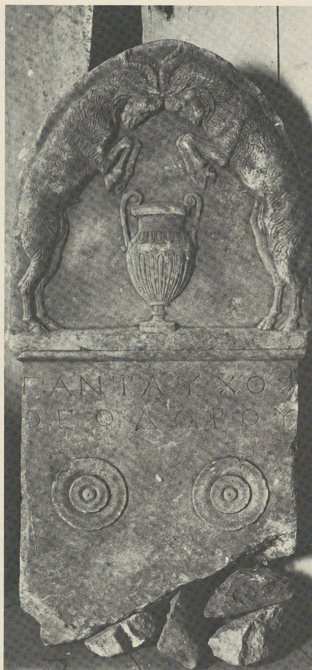
Fig. 2 : Stèle de Pantauchos.

L'inventaire, de même que le catalogue de Kastriotis 16 , nous apprend encore que cette stèle avait été donnée au Musée par Stéphane Dragoumis (1842-1923), plus connu sans doute par son activité politique, qui fut importante, que par ses travaux d'érudition, dont on n'a jamais dit trop de bien 17 . Dragoumis avait dû l'acquérir vers 1890, à l'époque où il siégeait au Conseil de la Société archéologique et où, surtout, il était député de la Mégaride 18 . On le voit en effet s'intéresser de près, durant ces années-là (1879-1895), aux antiquités de sa circonscription : en