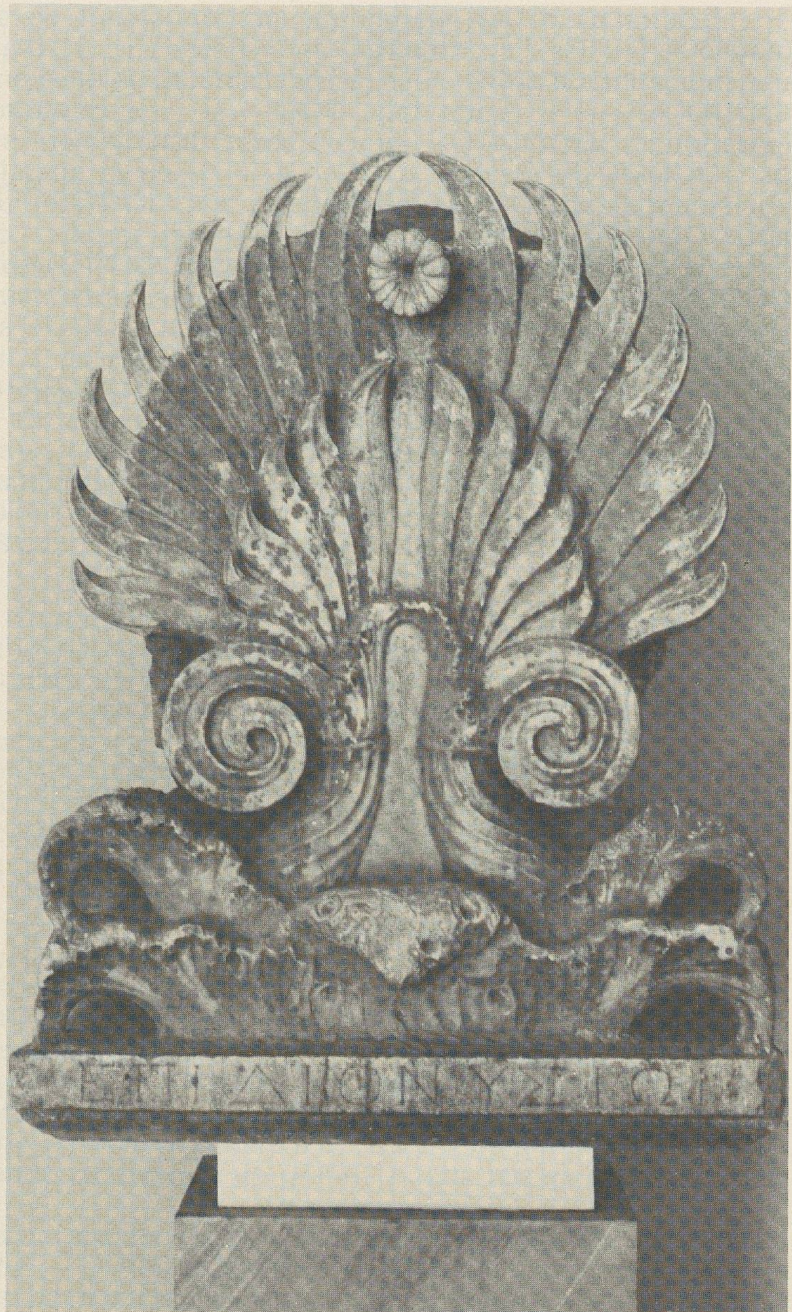
Fig. 4: Couronnement de stèle.

en attribuant le relief à l'époque romaine 48 : on a sans doute affaire — les spécialistes trancheront — à une œuvre du I er ou du II e siècle de notre ère. Le fronton, toutefois, par le type autant que par l'exécution, donne l'impression d'être plus ancien. De fait, il suffit de regarder un peu attentivement l'inscription pour s'apercevoir qu'elle est gravée sur un martelage; malheureusement on ne peut, je crois, déchiffrer avec certitude que la fin du patronyme de l'épithaphe primitive: - - - τειδου. Mais ce génitif «commun» est, à lui seul, un indice chronologique très intéressant, puisqu'il interdit de dater la stèle elle-même plus haut que le II e siècle avant J.-C. 49 , à moins de supposer, chose évidemment possible à Platées, qu'on ait réutilisé une stèle provenant de l'Attique.