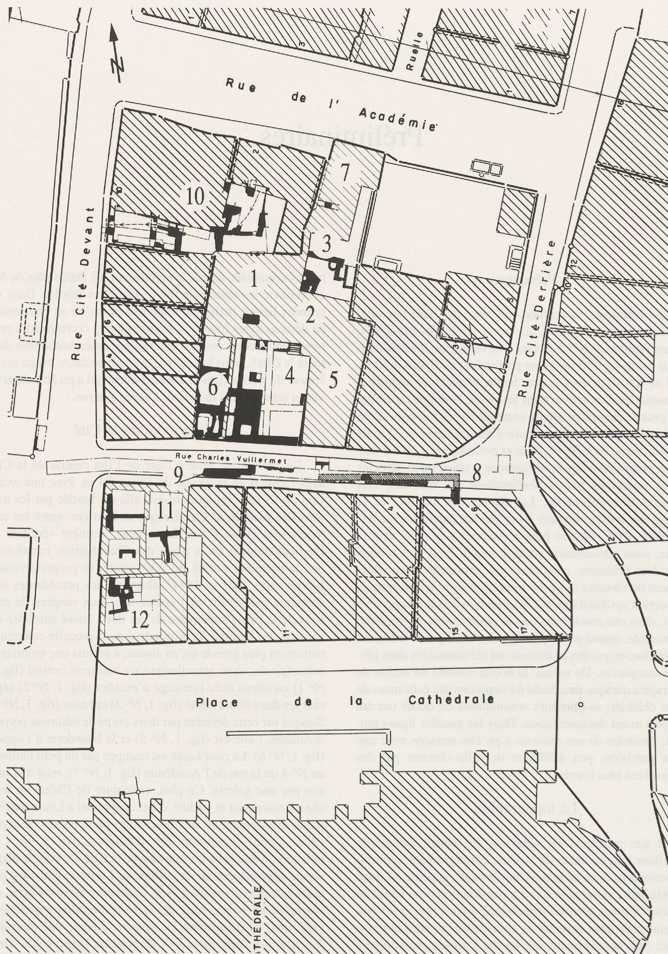
Fig. 1. Plan général des zones d'intervention; N° 1: la «Cour des Miracles», le bâtiment central; N° 2: la cage d'escalier; N° 3: la cour haute; N° 4: la cour basse; N° 5: l'aile est; N° 6: la buanderie; N° 7: le N° 4 de la rue de l'Académie; N° 8: l'angle nord-est du bâtiment d'époque romaine tardive; N° 9: la partie ouest du même bâtiment; N° 10: le N° 10 de la rue de la Cité-Devant; N° 11: le N° 2 de la rue de la Cité-Devant; N° 12: l'ancienne Ecole de dessin (éch. 1:500).