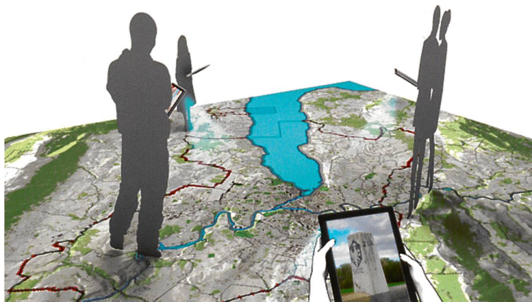
Abbildung 2: Erweiterte Realität – Grenzen überschreiten