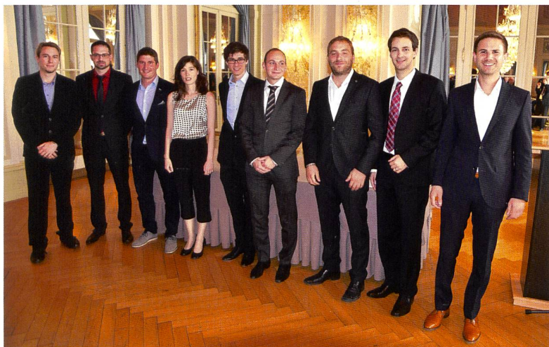
Abbildung (von links nach rechts):

Eine Ingenieurin und acht Ingenieure dürfen neu den Titel «Patentierte Ingenieur-Geometerin» resp. «Patentierter Ingenieur-Geometer» tragen. Sie wurden am 15. September 2017 nach erfolgreich abgeschlossenem Staatsexamen im Hotel Bellevue Palace in Bern patentiert.