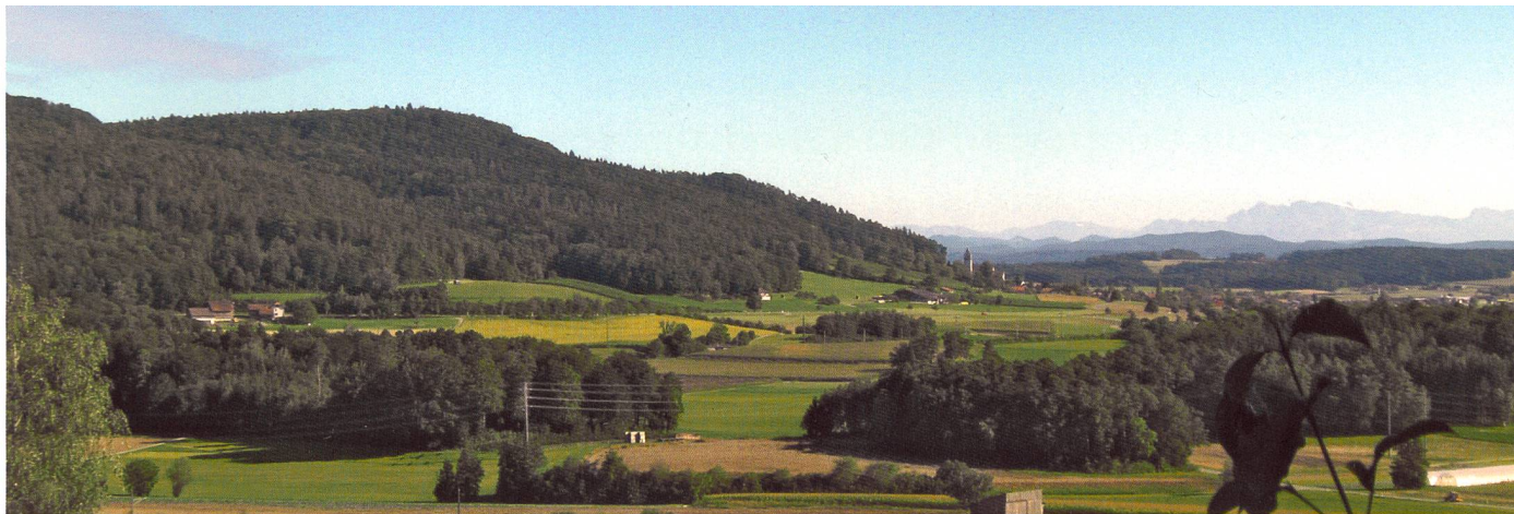
Schlattingen, canton de Thurgovie

vont se dérouler par étapes, tout au long de l'année 2014. Au début de l'année 2015, les nouvelles surfaces devront être introduites dans les données de l'office de l'agriculture (GADES). C'est pourquoi il convient de ne pas trop attendre pour procéder aux enquêtes.