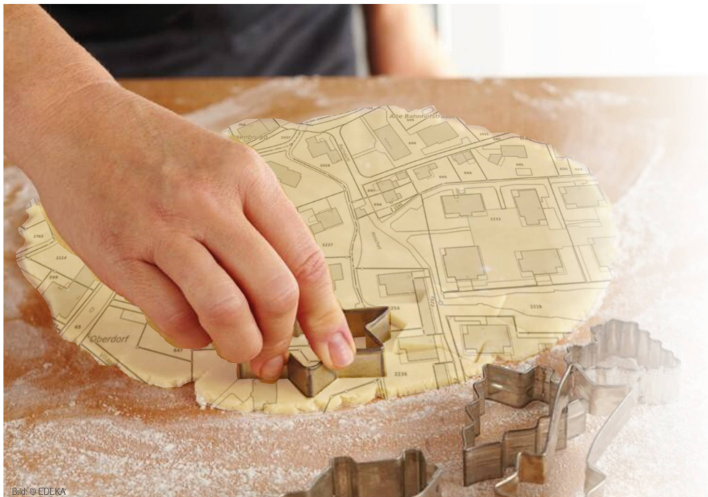
Figure 1: la découpe à l'emporte-pièce à travers les couches d'information

Aujourd'hui, les cantons disposent presque tous d'un accès par voie électronique aux données du registre foncier ouvertes au public. Dans ceux où cet accès fait encore défaut, des travaux correspondants sont en cours ou vont démarrer prochainement. On remarquera ici que les cantons ont développé chacun leurs propres solutions.