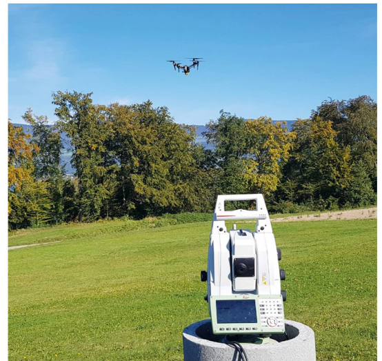
Figure 3: Le prototype en test

Des défis tels que la synchronisation temporelle et la communication entre les différentes parties du système ont dû être résolus. En effet, à l'heure actuelle il n'est pas possible d'horodater les mesures d'une station totale robotisée avec le temps GNSS de manière simple et précise ( < 0.1 s). Pour s'affranchir de cela, nous avons développé deux solutions.