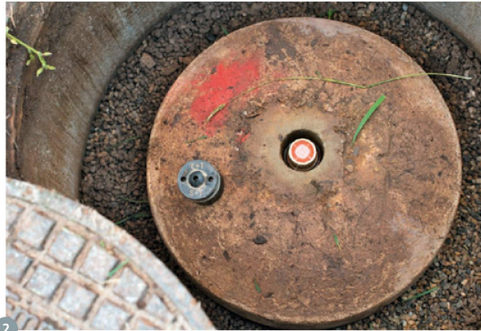
Figure 2: point fixe planimétrique type en plaine. La calotte (à gauche) est dévissée et une cible de centrage est montée sur la cheville mise à nu. Dès que la possibilité se présentait (ce qui n'était visiblement pas le cas ici), les points étaient directement scellés dans la roche, sans recourir à un socle en béton.