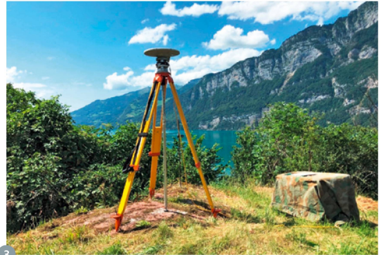
Figure 3: mesure GNSS statique sur le point de densification MN95 de Murg, dans le cadre de la campagne GNSS de 2022