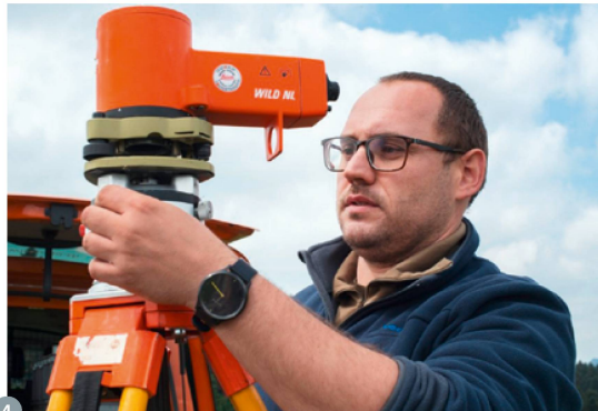
Figure 4: centrage au plomb optique. Le centrage garantit que l'instrument de mesure est mis en station à la verticale du point fixe.