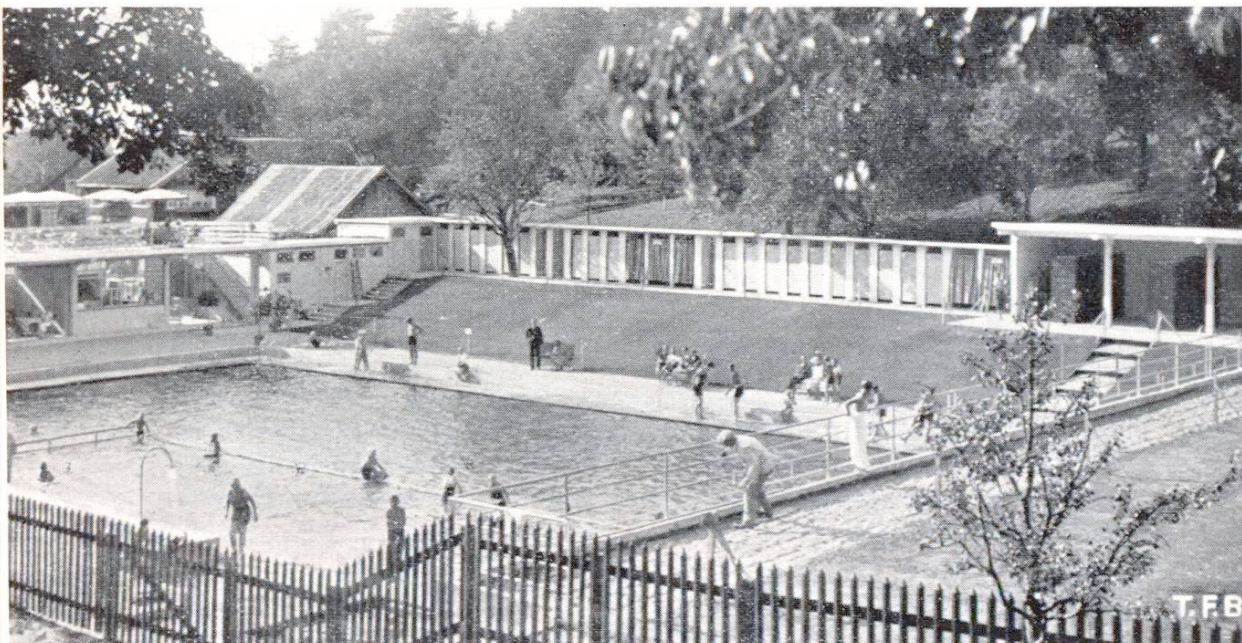
Abb. 3 Schwimmbad Walzenhausen (App. A.-Rh.) Decken sowie Aussen- und Zwischenwände aus Cement-Streckmetall. Tragelemente und Bassin aus Eisenbeton. Projekt und Bauleitung: Ing.-Bureau Keller, Brugg Ausführung: Bruderer & Calderara, Teufen-Walzenhausen

Verputze: Riegelbauten, heruntergehängte Decken und Gewölbe, Wasserreservoirs usw.