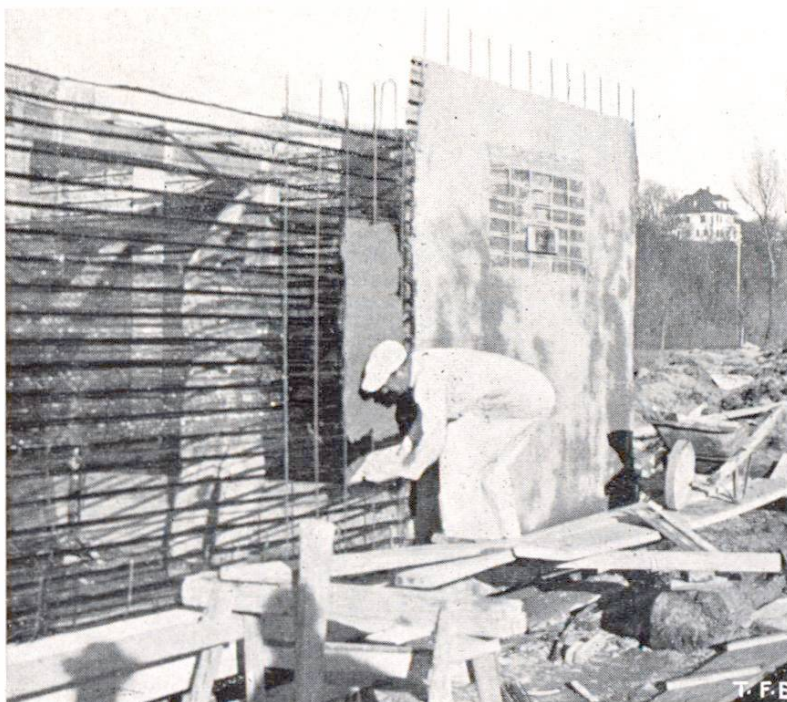
Abb. 1 Ausführung (Schwimmbad Möriken-Wildegg) Der Cementmörtel wird mit der Talosche aufgezogen; hinten eine fertig grundierte Fläche, die später noch abgerieben wird.

Zahlreiche kleine Hochbauten und verschiedene Konstruktionselemente können oft des Preises wegen nicht in massiver Bauweise hergestellt werden, obwohl nur Beton oder Mauerwerk allein imstande wären, die gewünschte Festigkeit, Dauerhaftigkeit und Feuersicherheit zu gewährleisten. Dazu gehören Kabinen und Räume für Strandbäder, Boot- und kleine Weekend-Häuser, hohe Umfassungs- und Spalierwände, verschiedene Decken, die alle in technischer Hinsicht mit grossem Vorteil aus Eisenbeton herzustellen wären, aber bei welchen die Schalungskosten prohibitiv wirken (30—70 % der Gesamtkosten des fertigen Eisenbetons). In solchen Fällen ist die Bauweise Cement-Streckmetall, die im Ausland seit Jahrzehnten bekannt ist, sehr wirtschaftlich, was schon bei mehreren Ausführungen in der Schweiz bewiesen wurde. Der wesentliche Vorteil bei der Verwendung von Streckmetall liegt darin, dass dieses Baumaterial Mörtelträger, Armierung und Schalung in einem einzigen Element vereinigt. Streckmetall wird aus gewöhnlichem 0,4—0,6 mm starkem Eisenblech in drei aufeinanderfolgenden Prozessen erzeugt: Schlitzen, Auseinanderziehen und Rippen. Sie kommen in Breiten von 0,6—0,7 m und Längen von 2,5—3,6 m in den Handel.